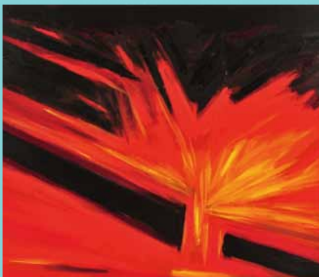
林勝賢（葛瑪蘭族+漢人） 形殤 No. 88

天災的反撲一夕間毀我家園，因果其來有自。畫家於 2008 年定居於台東都蘭社區，成為台東新移民的漢人畫家。本作品以敘事性的描繪手法，記錄風災帶來的水患，造成房屋傾倒、雞飛狗跳及居民無家可歸的漂流景象。