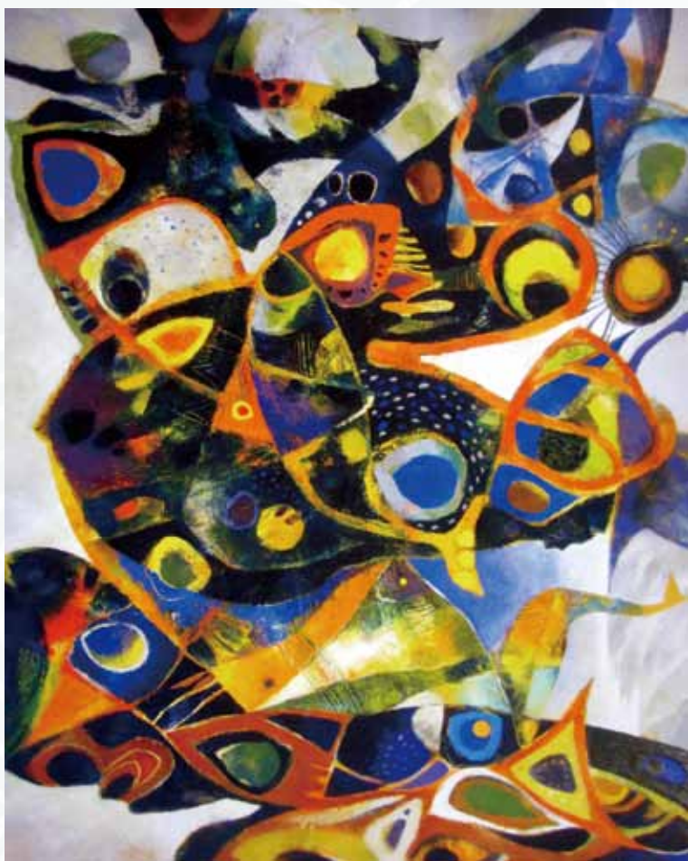
6 張培均 樂園 油彩 2009 162x130cm 優選

吳祚昌作品應用西方當代美術的具象和抽象混搭手法，透過獵人、山豬和祖靈圖象的組合，藉以展現台灣排灣和魯凱原民的狩獵精神。這幅畫榮獲台灣國展委員會的特別獎，作品視覺效果相當符合台灣當代美術館和藝廊的「泛原住民美學」類型。（圖5）