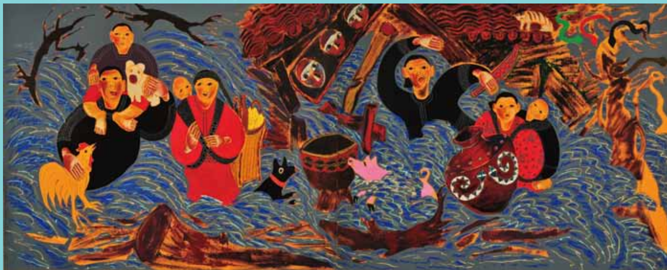
梁奕梵 那一夕的大水 麻布、複合媒材 2011 182×445cm