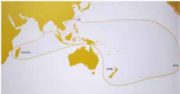
1 南島文化區域概念圖

南島語系民族之分布，東起南美洲西岸的復活島，南達紐西蘭的土著族群（毛利人），西至非洲東岸的馬達加斯加島，北至台灣及夏威夷，也就是中南半島的部分地區，以及太平洋和印度洋中的多數島嶼。