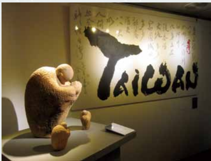
左 賴唐鴉 祈福

畫家是現任國際彩墨畫家聯盟秘書長，慣用突破傳統水墨空間處理的方式，把不同的物象或情境併置，企圖營造出似衝突又感通的畫面張力。作品中岩盤上的地瓜形似台灣島嶼，雖處於幽暗的生存環境，卻開枝展葉，綿延不絕，釋放出永生的張力。