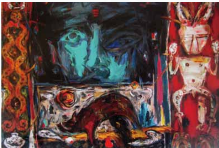
5 吳祚昌 祖靈・勇士山豬的獠牙 油彩、壓克力 2011 162x112cm 特別獎

祖靈是排灣族和魯凱族宗教信仰的象徵，並外化成為藝術圖騰；獵獲山豬成就勇士的精神，山豬的獠牙構成裝飾器物。