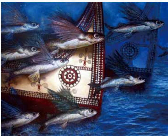
4 劉育仁 飛魚前行曲 油彩 2011 162×130cm 銅獎

透過上述創作者理念的摘錄可知，二十六歲的年輕畫家賴勇達有一股自我探索與自我表現的強烈意識，因而作品呈現近似西方表現主義人物造型誇張與變形風格。然而這幅銀獎作品的個人化情意表現，是否與南島民族的公共圖象產生正面意義的連結？值得探索。（圖3）