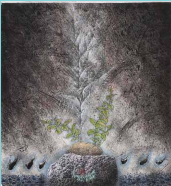
李振明 蕃薯無畏 69.4×64.7cm

畫家是現任國際彩墨畫家聯盟秘書長，慣用突破傳統水墨空間處理的方式，把不同的物象或情境併置，企圖營造出似衝突又感通的畫面張力。作品中岩盤上的地瓜形似台灣島嶼，雖處於幽暗的生存環境，卻開枝展葉，綿延不絕，釋放出永生的張力。