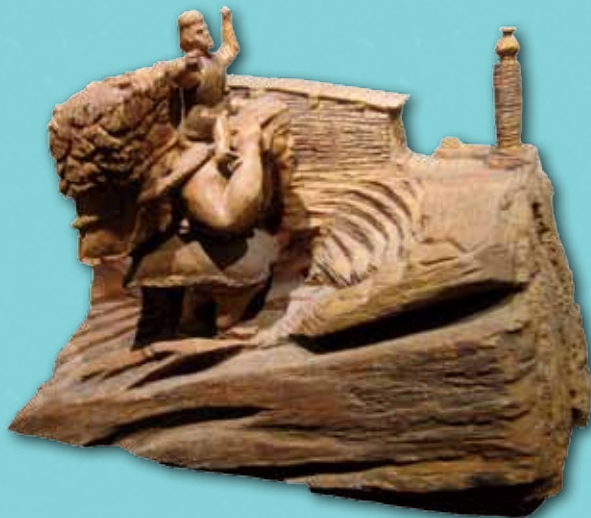
羅忠早（魯凱族） 回家的路沒了 2011 90×37×80cm

陶藝家在風災浩劫後，刻繪了八八風災吞噬了金鋒部落家園的災難記憶，屋舍如積木般被沖毀，逼得祖靈、太陽神也難過得流淚，部落族人因此跌入災難深淵無法自拔的哀傷。