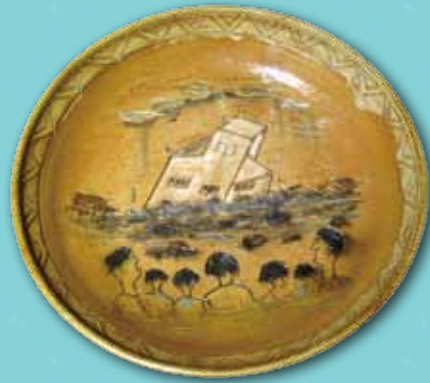
麥承山（魯凱族） 吞噬 陶盤 2011 30×30×6cm

台東太麻里溪，滾滾洪水帶走了家園，傾倒的房子像積木般翻滾在土石流之中，右下角的居民雙手合掌禱告，祈求祖靈幫助他們遠離災害。原民木雕家林新義曾任達仁鄉新化村的村長，他透過寫實的浮雕技巧，將八八風災的受難情景形塑於畫面，表現出在地藝術家自身遭受災難後的苦澀美感與村民祈禱平安重生的心願。