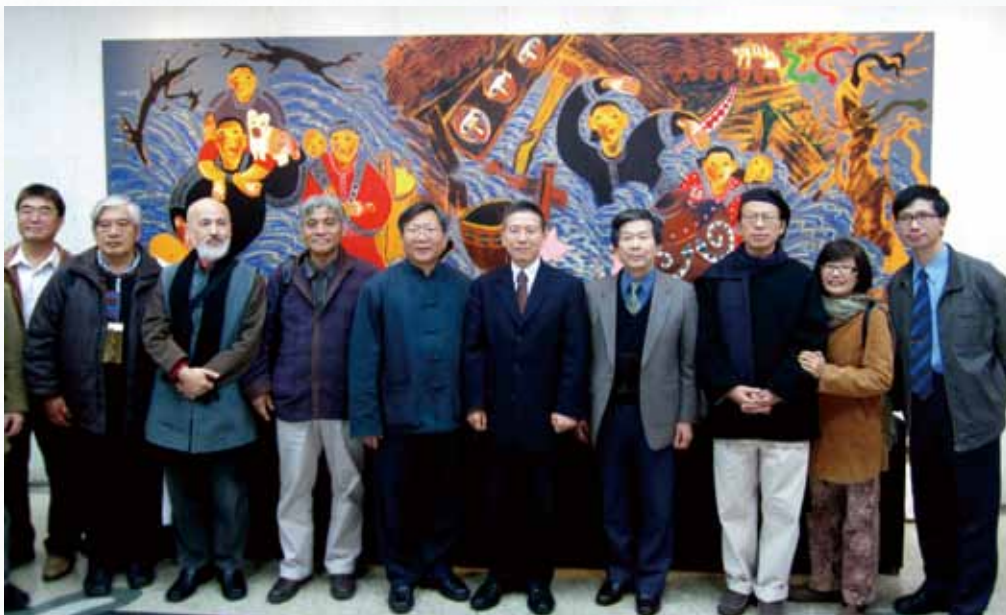
7 2011年12月16日參展藝術家合影於國立台灣藝術教育館之開幕展場