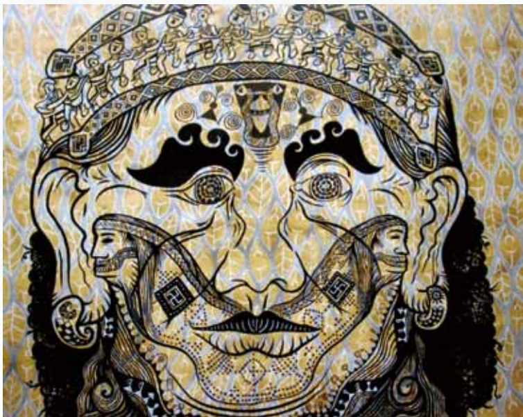
2 劉明樺 自然舞妝 油彩、壓克力 2011 162×130cm 南島美術獎

基於上述劉明樺的創作理念，這位未滿三十歲且具平面設計專長背景的年輕畫家，其作品獲得「南島美術獎」最高榮譽，引起參賽者的注目。就作品圖象元素而言，畫面是一幅台灣多元族群混搭性圖騰符號的拼構，組合出一位近似女巫身分的憂傷又茫然的臉譜。「混搭性」是後現代西方前衛藝術的創作手法，然而這件混搭的女巫圖像，雖贏得本次評審的青睞，但就南島族群文化角色的定位與與意涵是否也能贏得原住民觀眾的文化認同呢？（圖 2）