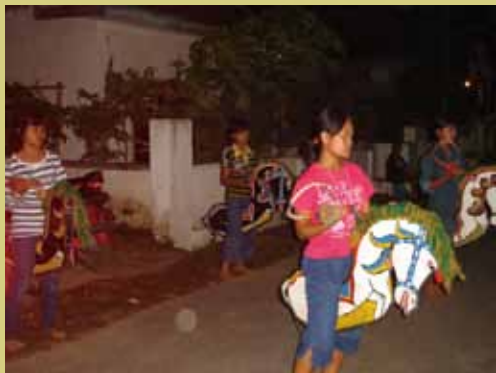
4 台灣特有的「薩菩蒂」練習場景