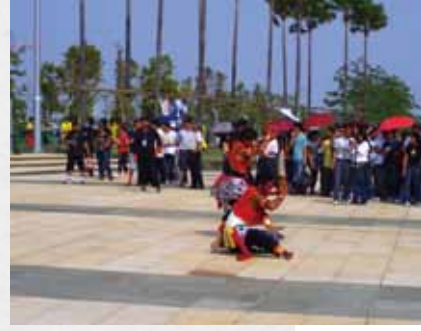
3 在台南公園演出的「都龍·阿貢」舞蹈方式