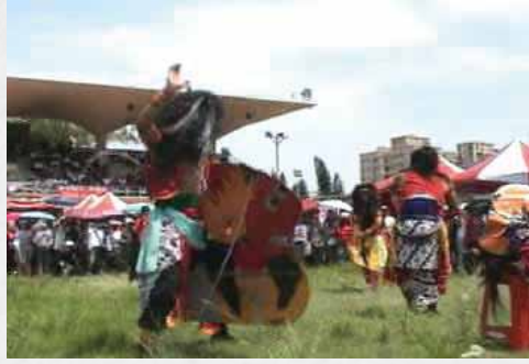
2 在台南公園演出的「班尤汪吉」舞蹈方式