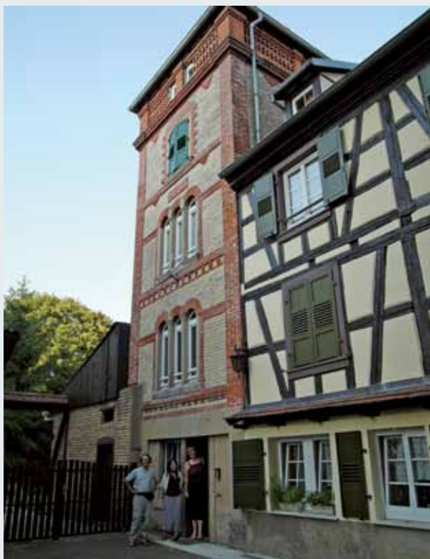
1 此樓房有 300 年歷史，造型高雅古樸。