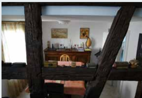
2 從客廳往下望向餐廳，中間穿過布滿歲月的粗糙木筋條。