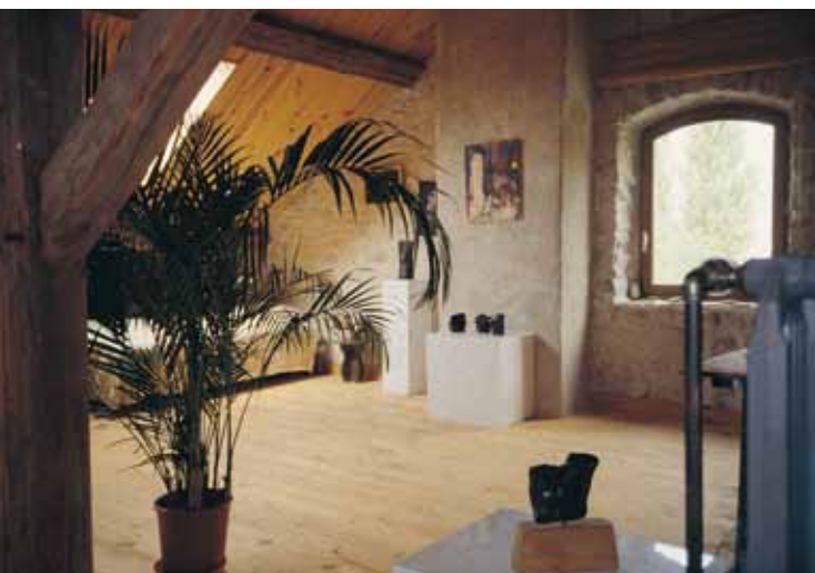
5 色調柔和，宛如畫廊的雅緻客房。