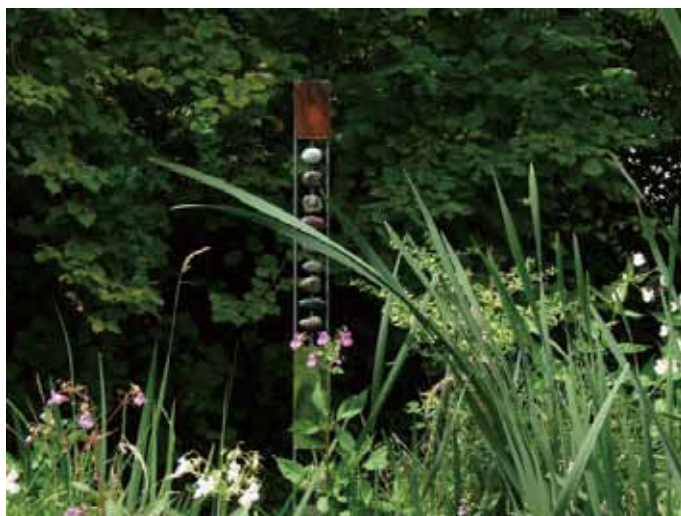
6 運用鐵材、石材創作的作品，裝置在自家花園裡。(瑪麗·克勞德提供)。

的創作媒材了，那是從雕塑延伸出來的，她開始運用玻璃的素材，並結合鐵材、陶土和石頭，圖6就是新的作品，去年展覽完後，就裝置在自家花園裡，與四周的環境搭配得極為協調與有韻味。她還就老子的道德經內容創作了幾幅畫，當然也是抽象畫風的。她接下來的夢想是做玻璃彩繪鑲嵌。