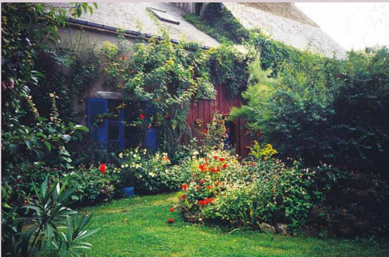
2 花園的一部分，生機盎然。

推了下前院的門，發現沒鎖，我們就進去了。哇！好美的花園！正值盛夏，花團錦簇，綠葉扶疏，看起來主人花了不少時間照顧它們。來到房子門口，推了一下，也沒鎖，我們就進去了。哇！好雅緻的布置！結合天然素材（石頭、木頭）的室內空間，和滿屋自己動手做的手藝品、繪畫和小雕塑。我不禁想這是怎麼樣的一對藝術家夫婦啊！我們就這樣入無人之境，遍遊了他們的家，臨走時，丹尼給主人寫了一張紙條告知誰來訪過了，並用一顆南瓜壓著，留在餐桌上，我們就掩上門離開了。