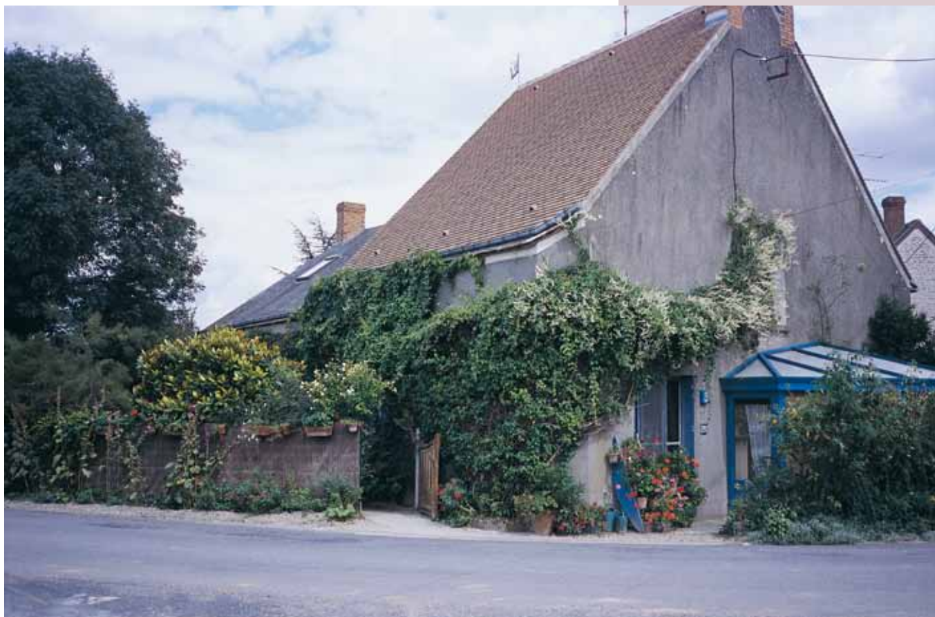
1 房子位於鄉間馬路旁，外觀樸實無華不起眼。