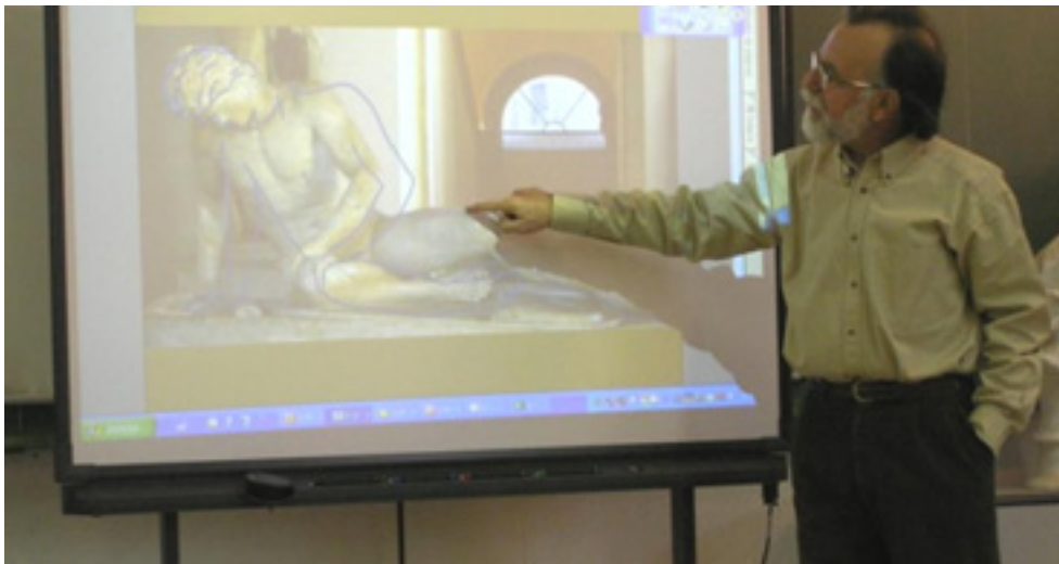
圖 4 UAM; 馬德里, 2005

我們應該將藝術教育視為瞭解自我與世界的過程 (Hernández, 2008)。現在只注重培養藝術學科的手工技能，是否合理？我們不能以訓練中小學學生或教師的方式，訓練專業的工匠或藝術家（圖 4）。