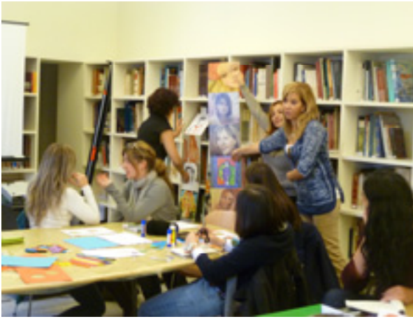
圖 8 化身工作坊，Viseu (2011)