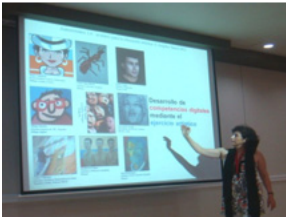
圖 6 化身案例；2012 賽普勒斯工作坊

如今自畫像已經不是史詩般的生平紀念碑。每次互動與評論，我們的大頭貼都會同時出現，成為我們網路身分的視覺象徵 (Asensio, 2011)。有些使用者從頭到尾只使用一個大頭貼，有些人則喜歡在網路世界的不同階段，不停更換大頭貼，更新或重新定義自己。想要反映自己的心情，仍得倚賴定型化的圖示符號。數位時代大量資訊不斷流動，而參與者也不停改變身分。習慣使用個人創意工具的藝術家可以用藝術方式，設計和更換自我表達形象 (圖 6)。