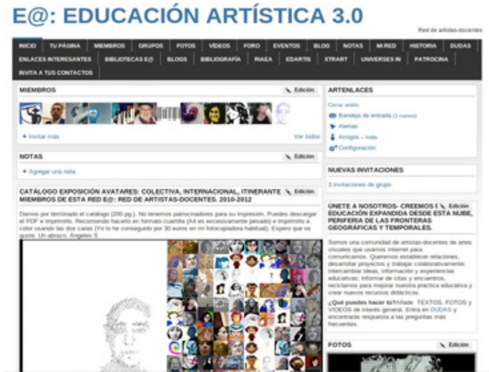
圖 2 E@, www.arteweb.ning.com

這項計畫以藝術形式為主，目前仍在持續發展中。透過此計畫，我們得以探討藝術家團隊如何透過網路參與集體活動。