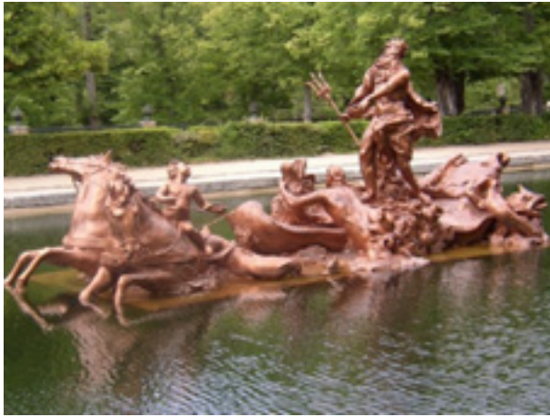
圖 5 海神噴泉 西班牙，賽戈維亞

如今自畫像已經不是史詩般的生平紀念碑。每次互動與評論，我們的大頭貼都會同時出現，成為我們網路身分的視覺象徵 (Asensio, 2011)。有些使用者從頭到尾只使用一個大頭貼，有些人則喜歡在網路世界的不同階段，不停更換大頭貼，更新或重新定義自己。想要反映自己的心情，仍得倚賴定型化的圖示符號。數位時代大量資訊不斷流動，而參與者也不停改變身分。習慣使用個人創意工具的藝術家可以用藝術方式，設計和更換自我表達形象 (圖 6)。