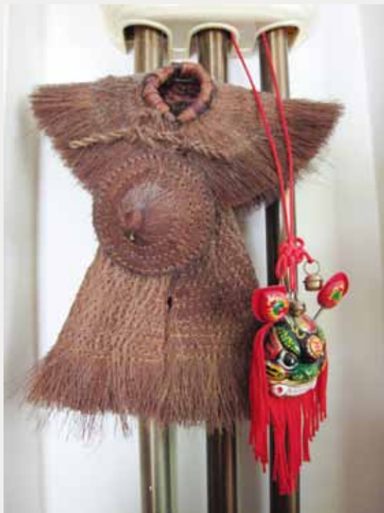
7 小簔衣及小舞獅頭掛飾。