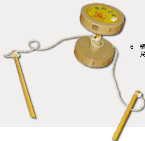
6 塑膠材質的台灣民間傳統扯鈴。

櫃，櫃中擺放各式雅致的中國人物花鳥陶瓷器皿，中華文化似乎已被移植至此美國社區內的這戶人家裡，並已扎了根，還與猶太裔的美國文化交融出美麗新樣貌（圖3）。