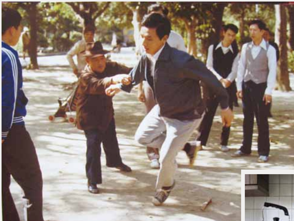
12 馬頓所拍的一張在當時叫做台北新公園的照片。