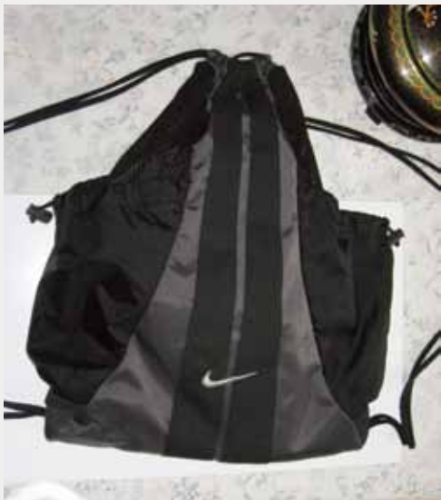
4 印有耐吉商標的黑色運動背包。