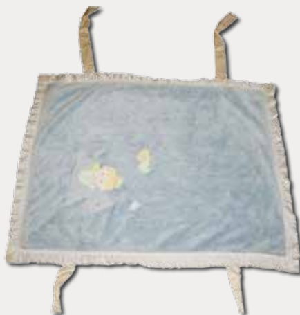
5 側邊縫有兩條帶子的方形淡藍色毯子。