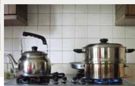
13 廚房爐台上的金屬材質蒸籠正在蒸煮中國式食物。