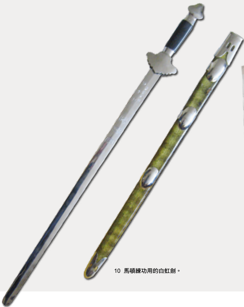
10 馬頓練功用的白虹劍。