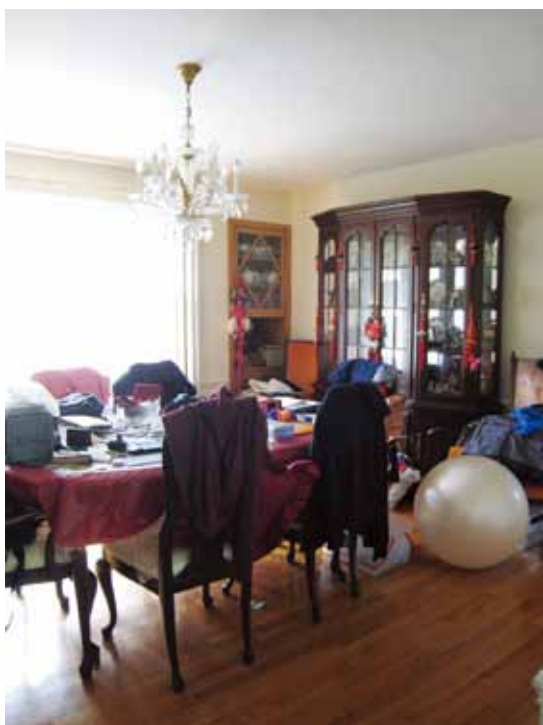
3 混融著中國情調的餐廳。

壁爐旁地面上立著一只大瓶口的高瓶身陶瓷花瓶，瓶身上繪有當代水墨畫，客廳中鋪著白色桌巾的矮方桌上，放置一個有龍紋瓷蓋的龍紋陶瓷容器，雪白牆上掛有綴著玉飾的紅色中國結（圖2），我很訝異在這設有壁爐的西式簡潔明亮客廳裡，中國式的視覺文化物件，可以存在得如此自然。