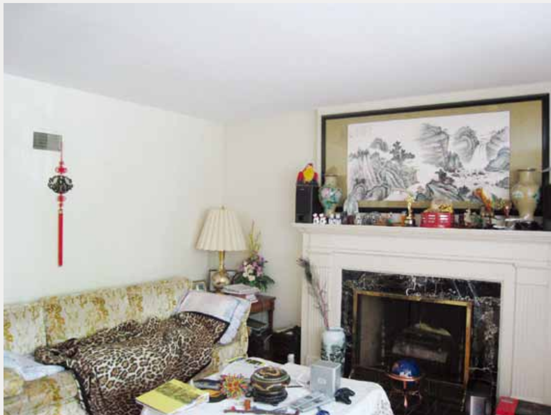
2 混融著中國情調的客廳。