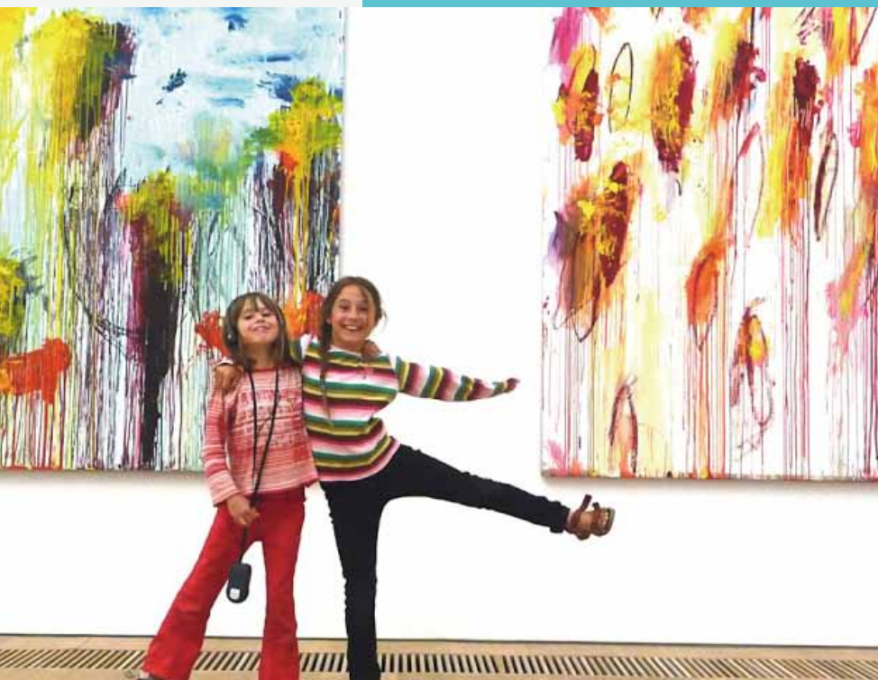
3 孩子們參觀展覽，非常開心。

史，現在還訂閱幾種藝術期刊，並且每週上 3 小時的油畫課，題材以風景較多，房子裡掛滿了她的作品。圖 2 是從樓上望向進門口，在簡潔的牆面上，作品格外清新。