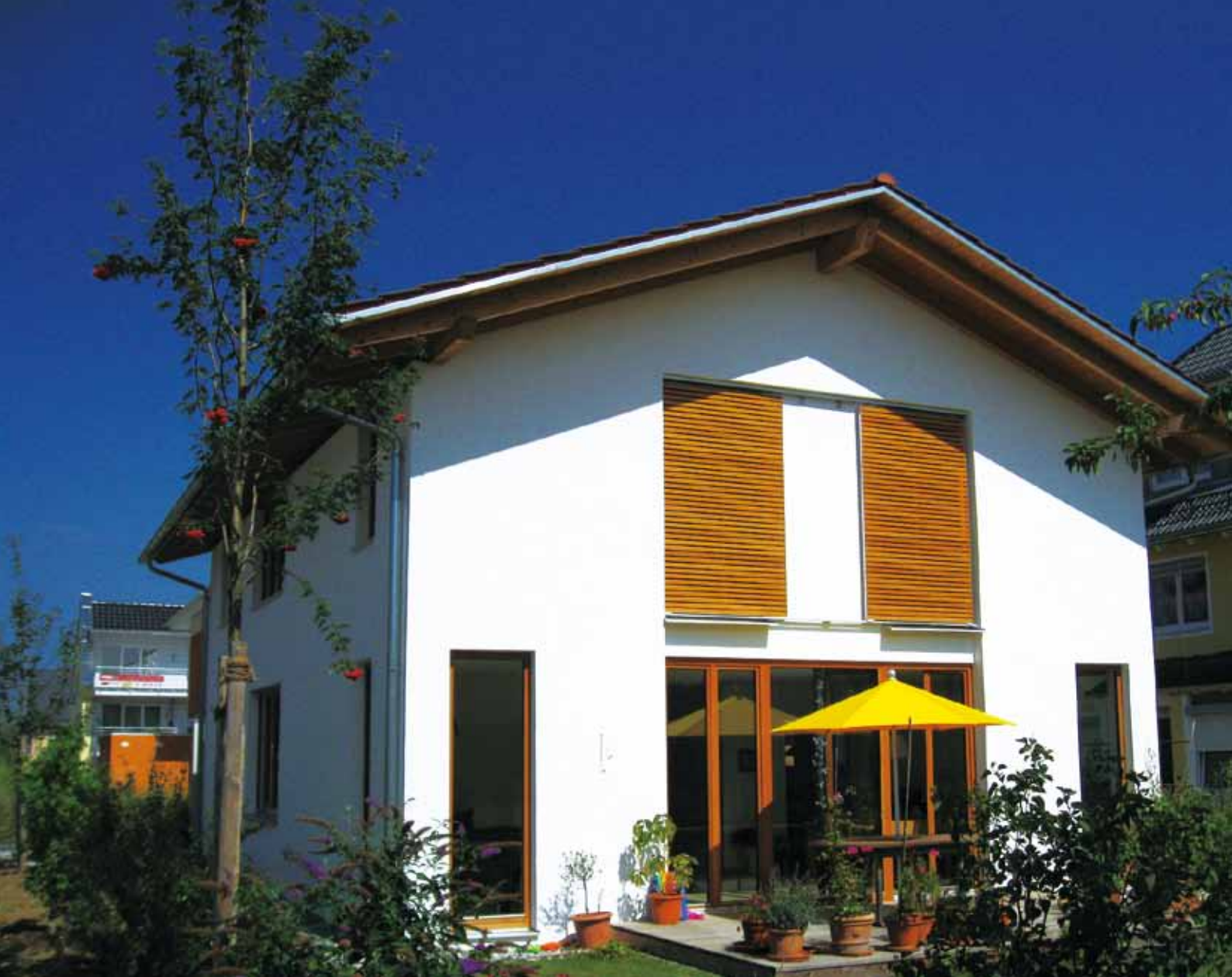
1 莫妮可和湯瑪士家的外觀，簡單樸素。