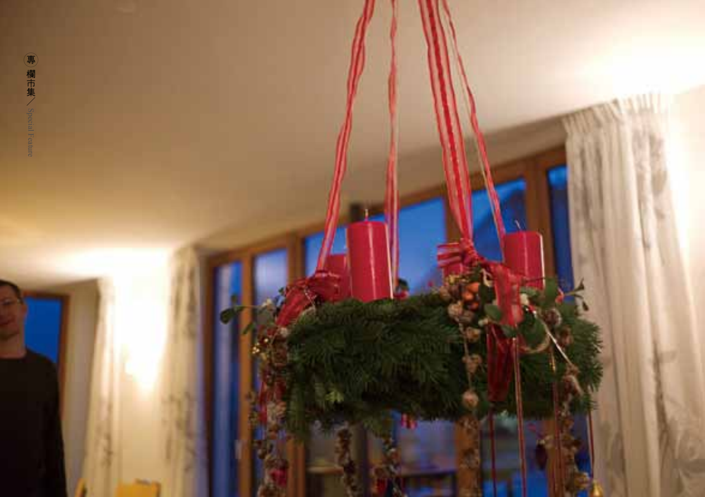
5 莫妮可做的聖誕吊飾，以及逐漸增加的蠟燭。