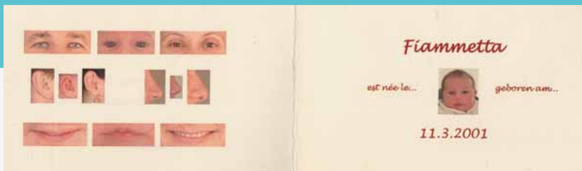
7-2 兩人為孩子出生所創作的報喜卡片。