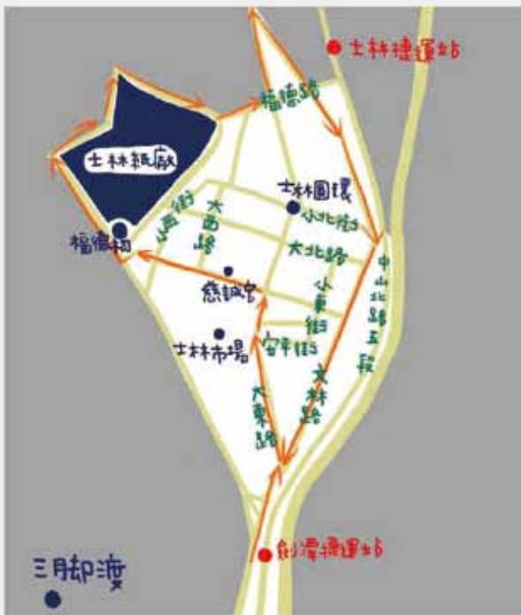
2 在出發前，調查小組針對士林地區大致畫出預計田野調查的路線。(楊佳霖製作)