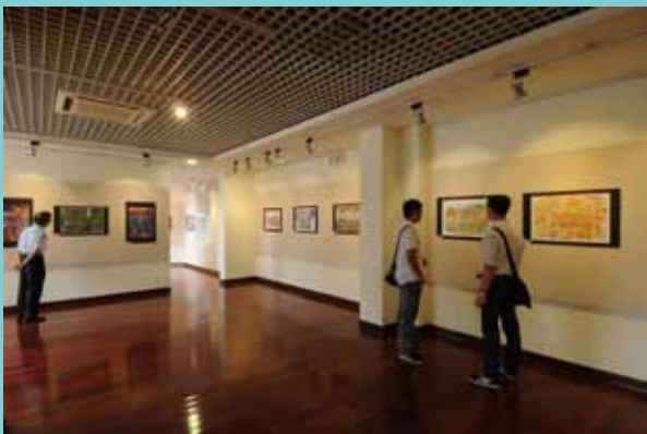
7 在士林公民會館舉辦「大城小調」插畫地圖教學成果展的會場實況。