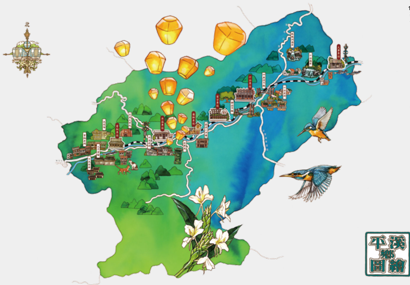
1 平溪鄉文化地圖。(王開立繪)

說到了旅遊記事，「風景寫生」也是常被應用的手法之一。風景寫生有時又被稱為戶外寫生，畫者運用輕便的畫具與紙張，將眼前所見的景物快速描繪出來，最大的特色是可以直接捕捉到大自然稍縱即逝的光影變化。相信一般美術科系的學生都有戶外寫生的經驗，戶外寫生能培養學生對於周遭事物的觀察力與構圖寫景的能力，同時也可以趁機學習到如何擷取現場的光影、時間等情境因素的變化，運用筆觸或顏料恰如其分地呈現出來。