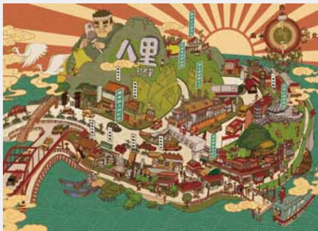
9 打石業之鄉 — 八里 (簡佑全等人繪)