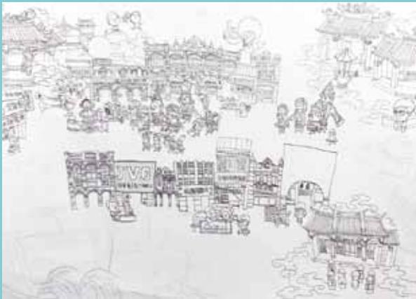
5 新竹市北門老街地圖的草稿。(林建宏繪)