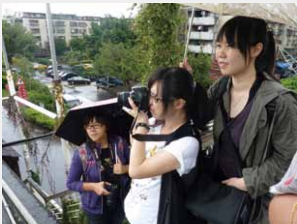
3 調查小組正在士林三脚渡堤防上進行現場觀察與資料蒐集。

是靠著一張地圖遨遊四海、探索世界。地圖不僅僅記錄地表現象與空間上的事物，舉凡山岳、河川、湖泊、道路、建築、城鎮，甚至於物產等相關資訊，而且還能將原本複雜的地理現象，以簡單扼要的方式表達出來，提供我們對於空間方面問題的解答。從小，我們便從地理課本中各式主題的地圖，認識到自己國家的疆域、物產、歷史等知識，甚至在地圖中看見了全世界。時至今日，隨著科技的發達，地圖的繪製早已運用人造衛星空拍技術結合電腦繪圖方式來完成，不僅精確度大幅提升，人們更能夠透過網路系統，大大提升地圖的導航功能。