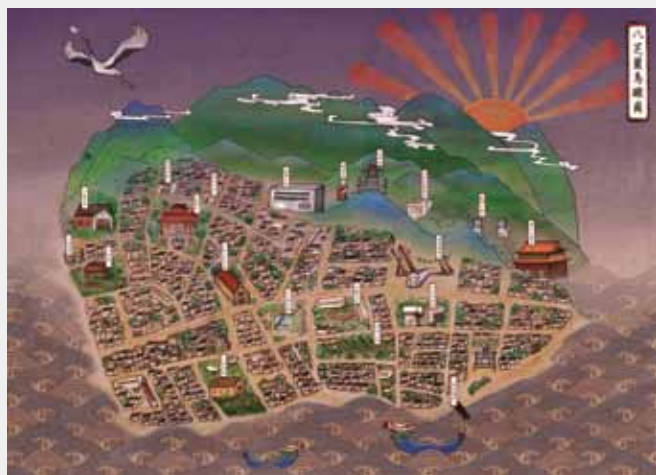
10 士林 — 八芝蘭鳥瞰圖 (林彥均等人繪)