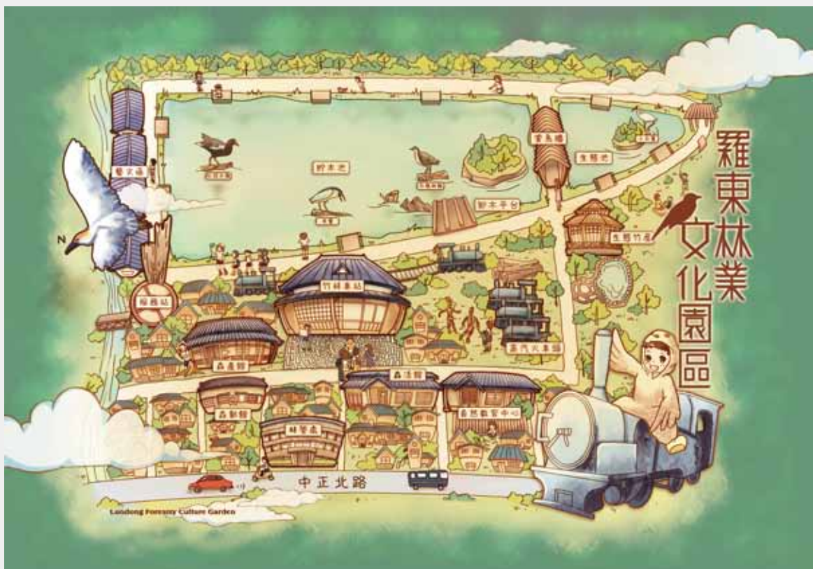
12 羅東林業文化園區導覽地圖 (陳映羽等人繪)