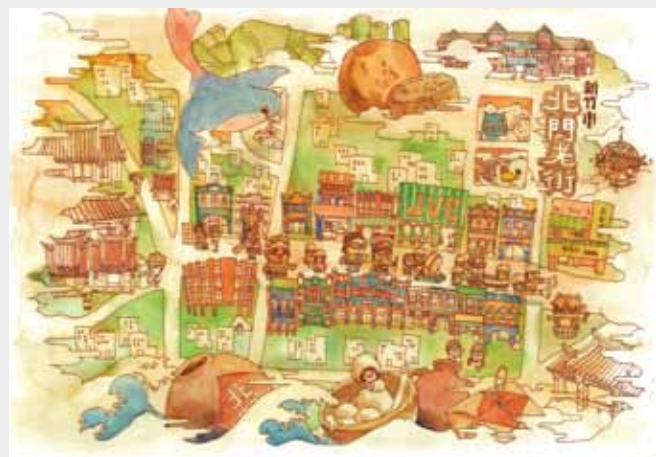
11 新竹市北門老街地圖 (林建宏繪)