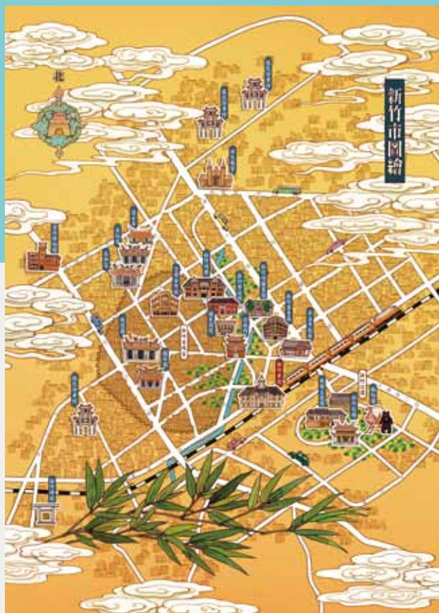
4 新竹市文化地圖。（王開立繪）

在我指導的「文化創意產業」課程之中，特別安排了大約三週地圖插畫的入門教學單元，專門介紹地圖的種類、地圖構成元素、空間表現手法、繪畫風格等知識。為此，我還特別準備一疊過去蒐集到不同地區的地圖作品給大夥兒參考觀摩，提供學生藉機吸取足夠的地圖養分，並讓他們觀察各種不同地圖的插畫表現手法。最重要的是，我也藉機捲起袖子與學生們一起埋首於手繪地圖的工作，並在過程中分享彼此地圖創作的心得。（圖1）