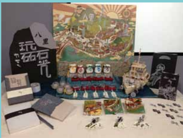
6 八里打石業調查小組的文創商品開發與文化地圖展示。