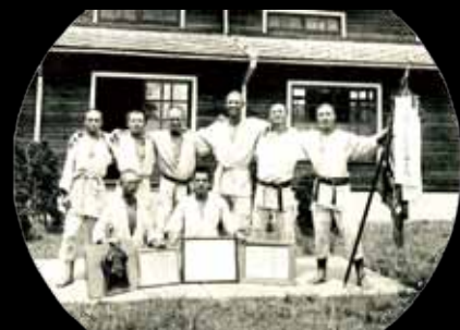
12 體育社團 — 柔道。