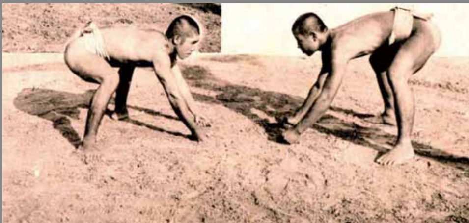
11 學生社團 — 相撲社。