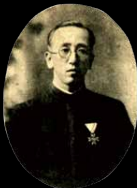
鹿討校長先生 (第五屆)