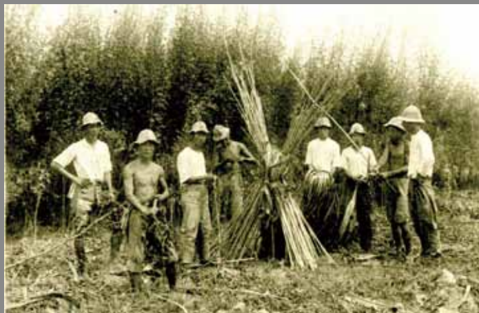
10 學生的實習課 — アンバリヘンプの收成。 (指黃麻或大麻類的植物)