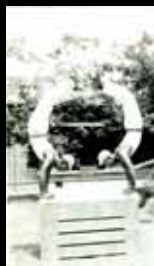
體育社團 — 體操。