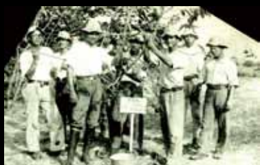
學生的實習課 — 牛心梨(ギウシンリ)的栽種。