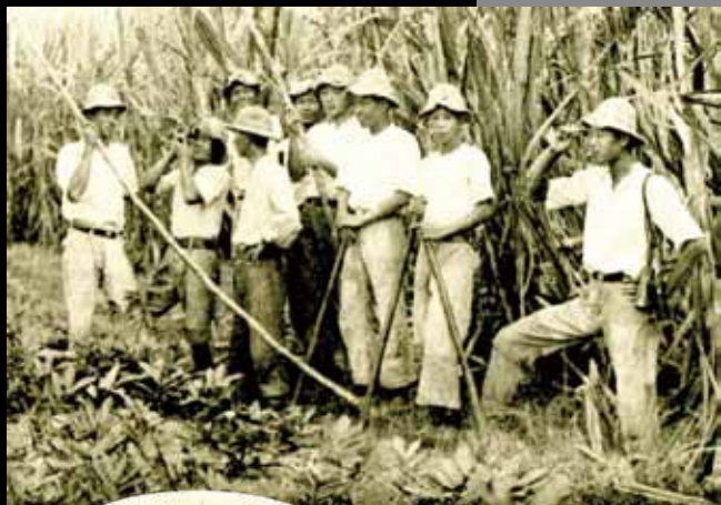
學生的實習課 — 糖份檢查。