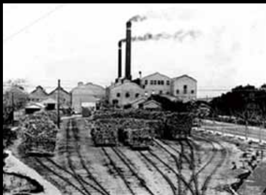
18 新營製糖所。（百年糖鐵風雲 http://www.tmitrail.org.tw/?page_id=815&page=3 ）