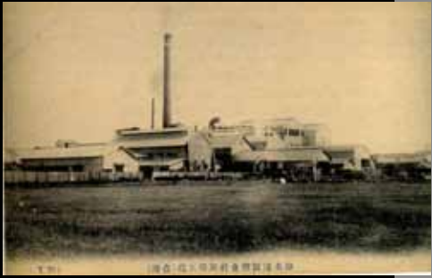
15 鹽水港製糖株式會社。