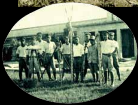
學生的實習課 — 測量。