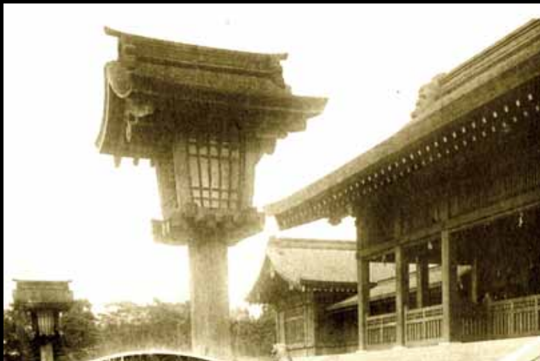
26 1915年建於嘉義農林學校附近的嘉義神社。