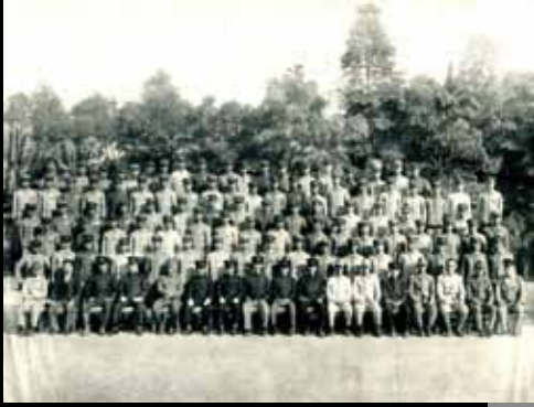
14 昭和 18 年嘉義農林學校的畢業合照。