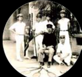
體育社團 — 網球。