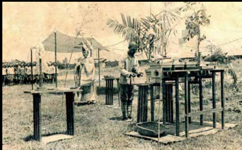
25 台南州立嘉義農林學校的農耕祭典。

的教育，好處是讓台灣的新制教育更完善，而嘉農也於 1923 年起開始招收日本人，然而，伴隨著無法抹滅的種族問題，以及被統治社會下的不平等，嘉農逐年增加的日籍學生，確實排擠到台灣學生的就學機會。