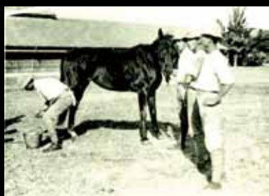
學生的實習課 — 畜牧。

村 朋一(1937.4-1940.4)、鹿討 豐 雄(1940.4-1943.4)、西崎 茂 (1943.4-1944.2)等三位校長(圖 8)，授課的老師也都是日本人(圖 9)，校長和聘任的師資，大都畢 業於帝國大學或師範學校之農業或 理科學系，其中如鹿討校長曾於英 國留學，亦可教授英文課，就其師 資來說，素質不算差，顯示總督府 相當重視台灣的農業教育。