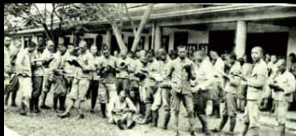
2 嘉農的畢業考，學生在考試前拼命唸書的情景。

的影像記憶，與訪談外公從求學到工作的歷程，追尋台灣 30-60 年代所經歷的文化混雜現象與紮實的實業教育訓練，探索日治時期台灣文化、教育與糖業的發展，以及其對台灣社會所造成的影響、意義與文化意涵。