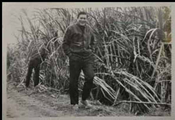
20 外公巡視蔗園的情景。(家族照片)