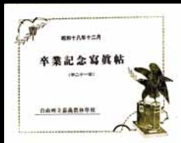
1 外公周登科於昭和 18 年所拍攝的畢業照。