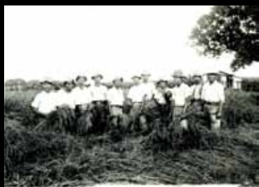
學生的實習課 — 秋收情形。