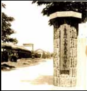
3 台南州立嘉義農林學校。