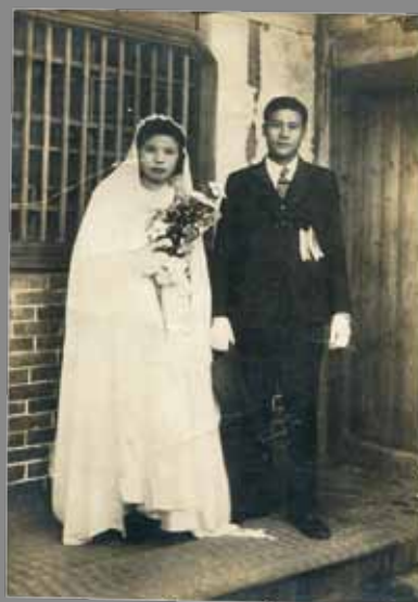
23 外祖父母於西元 1946 年在台南拍攝的結婚照。（家族照片）