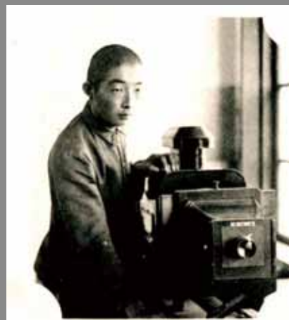
學生社團 — 寫真班。

太郎指導，開始培育出優秀的棒球選手，並於1931、1933、1935和1936年四次代表台灣中等學校，前往大阪參加在甲子園舉辦的「全國中等學校優勝野球大會」，這可是比「紅葉少棒」早了30年。外公雖然沒有加入棒球隊，但談起棒球比賽，也難掩興奮之情，這已經成為嘉農的運動傳統，也是其精神所在（圖13）。