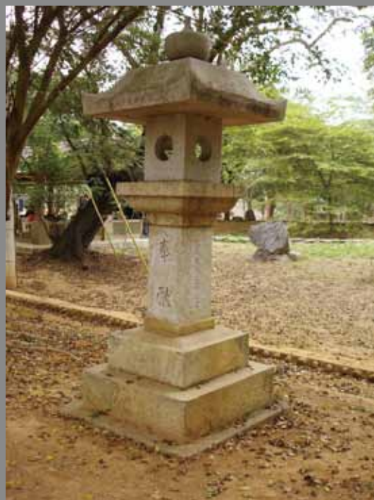
27 1943年所建的嘉義神社參道旁的石燈籠以及神社附屬建築齋館，現為嘉義市史蹟資料館。