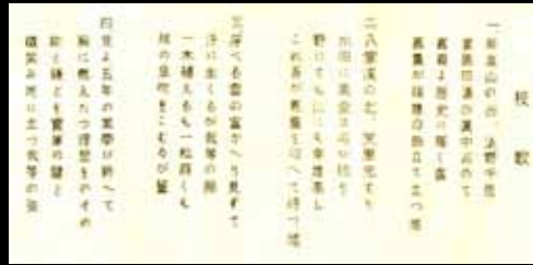
4 台南州立嘉義農林學校校歌。