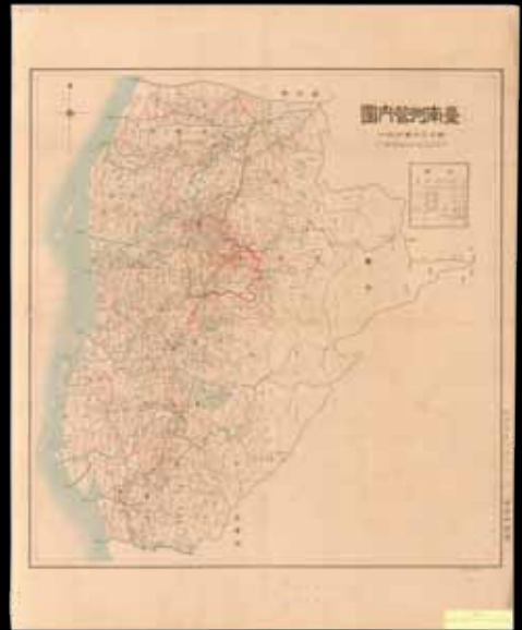
5 台南州管轄地 (引用自 http://zh.wikipedia.org/zh-tw/File:Tainanshu_Kannaizu.jpg )

後，也必須在上學前或放學後，到田裡幫忙、從事餵牛等工作，對於年紀還小的孩子來說很辛苦。