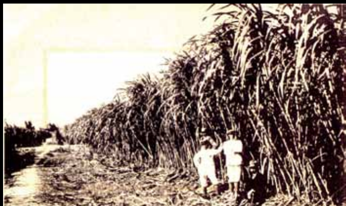
19 日治時期的蔗園。