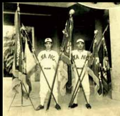
13 嘉農的野球隊的明星球員。