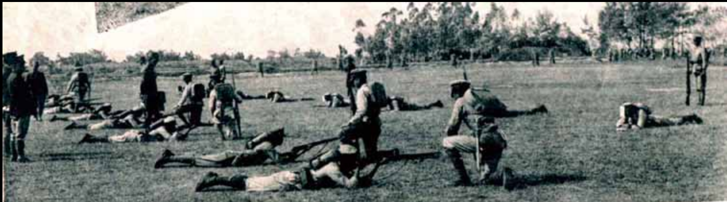
21 學生們的軍事訓練。

戰爭的影響持續的這幾年，民生物資都相當缺乏，圖 23 是外祖父母於 1946 年所拍攝的結婚照，當時外公穿著西裝，右手拿著帽子，外婆則是穿著西式婚紗，新娘禮服是當時流行的樣式，頭紗長到幾乎快垂到了地，手裡拿著花束，外祖父母站在台南老家窗戶前拍照，地上僅用草席鋪地，顯得相當簡陋，簡單拍攝的結婚照，在時局混亂的年代已是相當隆重的婚禮，這是他們唯一的結婚照。