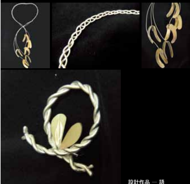
設計作品 — 語