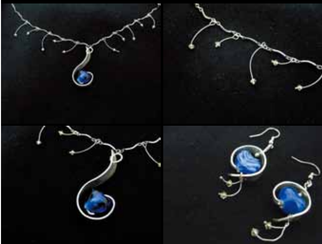
設計作品 — 心懸