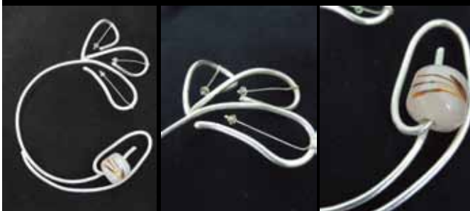
設計作品 — 孤

創作理念： 花瓣少了一半總是不完整，再以琉璃珠燒製出蕭瑟的感覺，串於花苞間，傳達出母親孤獨的思念，再以閃著微光的水晶，詮釋母親永遠點著燈，以備遊子隨時可以找到回家的方向。