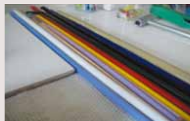
金屬及玻璃材質（左：金屬材料；右：玻璃棒）