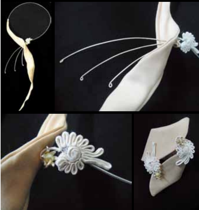
設計作品 — 釦·扣