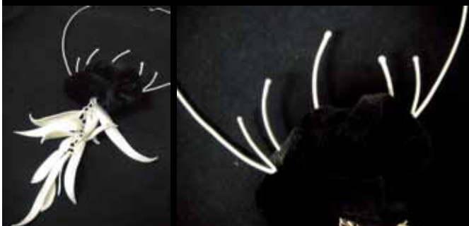
設計作品 — 影

創作理念： 每個長髮飄逸的女性背後，一定有一束馬尾，原因無它，就是為了要照顧自己的寶寶，無暇梳整，索性就紮起了馬尾；許多母親年輕時，也愛留著飄逸的長髮，為人母後，縱使已剪去心愛的長髮，但那個紮著馬尾的背影，卻總讓孩子們記憶深刻。以金針花瓣化作髮絲、紮起的髮紋做花蕊，傳達母親為了孩子犧牲奉獻，不惜付出自己的青春。