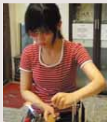
琉璃工坊創作過程