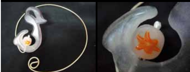
設計作品 — 念戀

創作理念： 以一位女性彎腰蹲坐的儀態，懷抱著一顆金針琉璃珠，表達出思念離家孩子的心情，藉著照顧懷裡的金針花，一方面卻也想照顧自己的孩子，那個離她肚子最近的地方，最需要忘記的煩惱，卻也是最忘不掉的念戀。