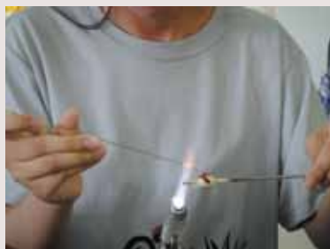
上玻璃材料於珠體