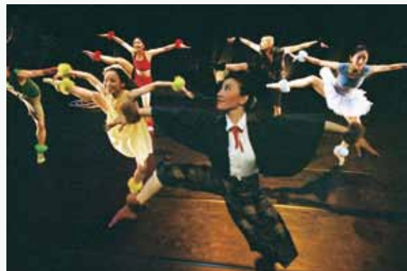
12 史派德奇遇記之八腳伶娜 楊銘隆編舞 舞蹈空間舞團 2003