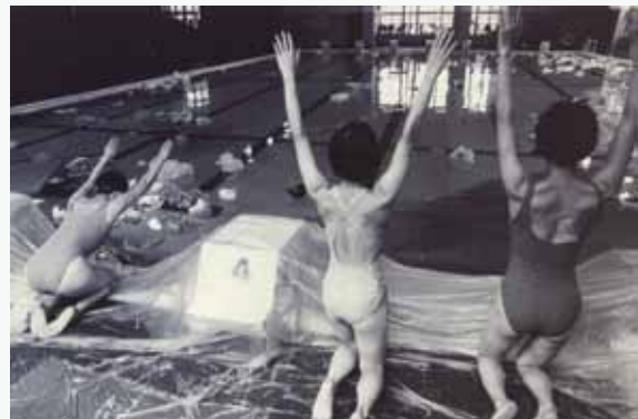
11 繞地遊 — 拜水 蔡必珠編舞 舞蹈空間舞團 1993