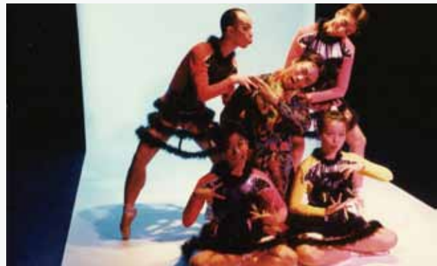
2 西遊記 彭錦耀編舞 舞蹈空間舞團 1994