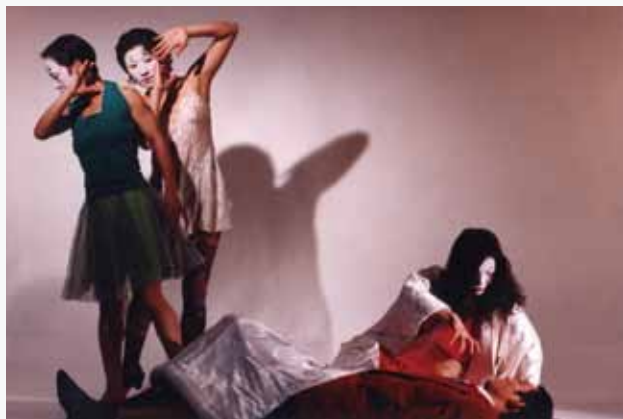
5 怪談 彭錦耀編舞 舞蹈空間舞團 1996