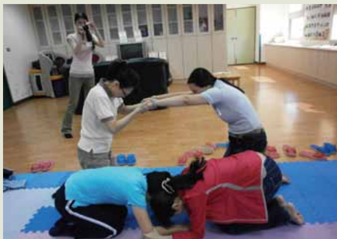
1 「說故事」志工們研習戲劇教學活動課程，以肢體創造一支電話