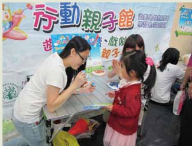
6 行動親子館裡的闖關活動—眼明手快，孩子手中持著闖關卡，向志工姐姐索取章戳。