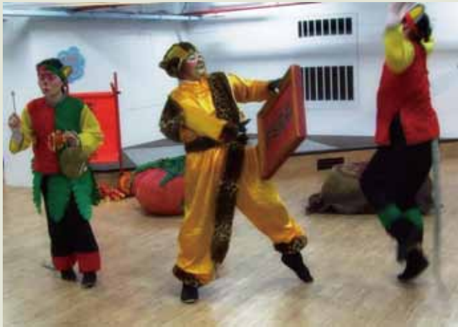
3 「老鼠娶親」是鞋子兒童劇團的代表作，是一齣結合傳統戲曲表演與現代兒童劇場的好戲。