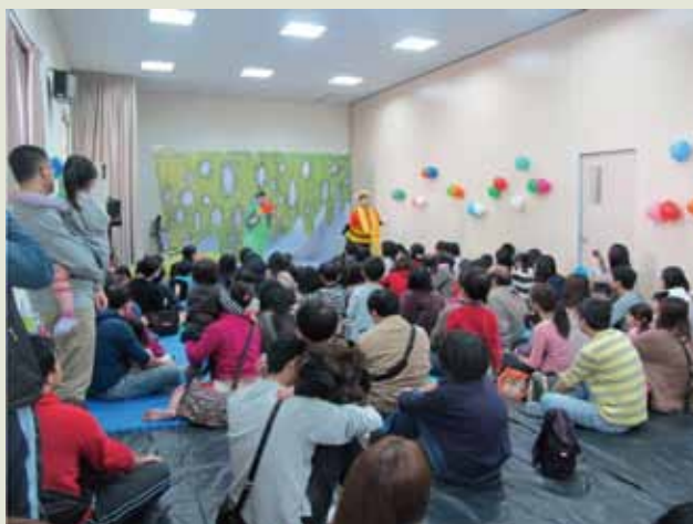
5 行動劇場演出劇目—「安拿生故事盒」，此劇以風趣奇想的對話，引動兒童開啟哲學思考。