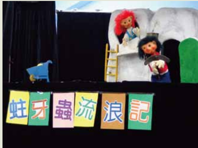
4 「蛀牙蟲流浪記」改編自德國的『Kariusand Baktus』，透過戲劇表演，讓觀眾得以了解牙齒保健的重要性，也是鞋子劇團早期代表作品之一，很獲幼兒觀眾喜愛。

至於來訪的遊客，主要以中正區內三元街附近的居民為主，但也有來自板橋、新店、汐止等地的家長帶著幼兒前來。這是一個免費的專業活動館，在管理上也別有特色，本來不分場次時段，但現在為了便於管理，也開始有預約與規定，每場採部分預約 20 名小孩，其他開放現場報名，一場大人與小孩以 80 人為限，並且力行環境消毒；經營上也有會員制，會員以 0-6 歲幼兒為對象，是個指標型的親子館，每個月至少有 3500 人次的訪客，使用率與民眾支持的反應，都相當不錯。