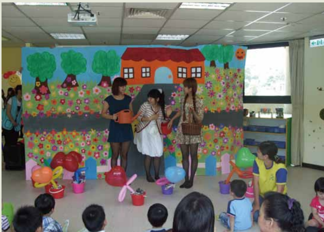
8 經國幼保系學生演出「茉莉花園」劇照