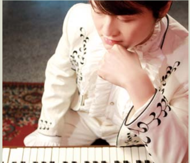
本文主角小可現職為音樂教師，兼職音樂伴奏。

呈現的品質，更為嚴苛，我狂練、每天除了吃飯、睡覺，就是在琴房不斷的練琴，直到那週老師點頭或同意，說我有進步我才會稍微放心」。即便學生具備音樂班的優質能力，但在台灣學校專業音樂教育中的主修個別課程，前有提及為沿用十九世紀德奧音樂院之訓練，因此主修教師與學生之相處互動最為密切與頻繁，對於學生的學習、價值觀建立以及心理層次等影響，實為直接與深遠（徐秀娟，2008），由此可知學生在音樂上的資優，除其資質外，在學習的過程上，其主修老師的態度與指導，實為深刻影響學生學習的因素。