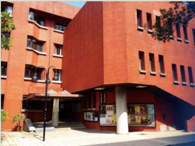
國立臺灣師範大學音樂系為國內培育出許多傑出之音樂表演人才。

性 (generative) 且為一感官動作 (sensorimotor) 之過程，這些發展的歷程均依附於個體的年齡與經驗。小可即指出：「以前彈琴，並不會去在意太多，也沒有想太多，就直覺式的認為有彈對音就好，直到大了一些後，看的音樂會多了，聽過許多好聽的錄音與 CD，同時也見多識廣，更瞭解自己的定位了，雖然表現的不可能如錄音室中的完美，但我會多去琢磨自己的技巧，音色也會去加以調整，以希望自己更厲害。」就像 Sosniak (1985) 曾對二十一位得過世界鋼琴大獎的年輕音樂家進行訪談，得到其學習生涯的發展可分為：開始學習、青少年與進入成人的階段，慢慢成熟與心境上的突破，成為「音樂家」的旅程。或同時回到台灣的時空脈絡，劉佳蕙 (2001) 也分析台灣音樂資優者的三個個案，得到五個階段：興趣嘗試、學習探索、專業學習、轉型、自我嘗試定位等五期，似乎正可以呼應上述小可的言談，自幼的學習、大量的練習、師承的老師與其互動精進的過程等。