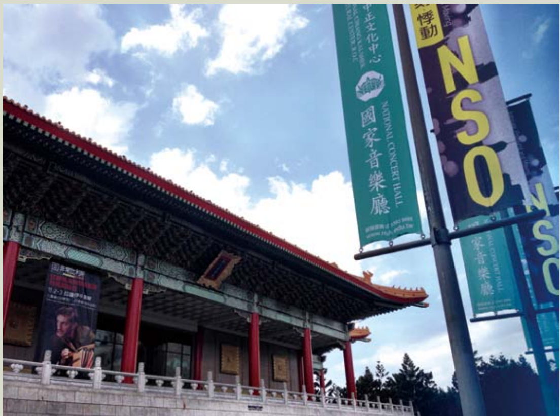
國家音樂廳係台灣重要的音樂表演場地，與國家戲劇院合稱「兩廳院」。