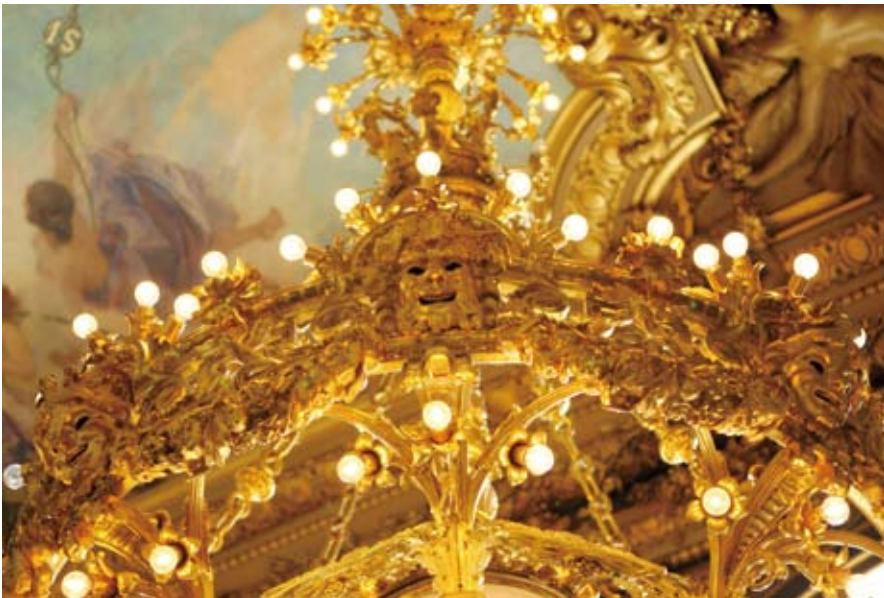
15 喜劇歌劇院中使用電的大型吊燈上面有不少面具裝飾。

在喜劇歌劇院中最常出現的形象，便是面具！古代的戲劇無論內容是喜是悲，表演者都會帶上面具來演出。早在希臘羅馬時期的戲劇中，面具已具有一定的重要性，表演者隱身於面具之後演出，雖然這樣的方式較無法表現個人特質，但卻有利於觀眾清楚地透過面具來了解演員角色的狀態與情境。同樣的符號也一再出現於各類型的劇院細節設計之中，象徵著戲劇的起源與精神。