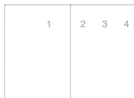
圖 3 是位於捷克古城 Cesky Krumlov 的一家咖啡店，門上方除了鑄鐵招牌外，最吸引人的雕塑是兩個分站兩旁，著古典服飾的低頭女士（木頭雕製），一個面朝向外，一個面朝向內。整個雕塑

圖 2 是此商店的另一個進門，除了同樣的基調與布置外，門口亦擺放以馬賽克瓷磚拼貼的手製鏡框、半圓桌和茶几（配合鐵製桌腳），整體散發溫暖又活潑的氣息。