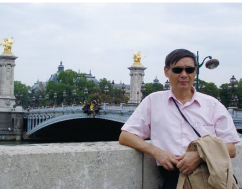
1 詩人胡爾泰於塞納河畔留影。

胡爾泰出身學院，文化史與宗教史係其研究專業，其乃學院中少數能左手寫現代詩與古詩，右手寫史學文章的能手。其詩作質量精純，文字細膩，時而浪漫感性，時而冷峻慧點，散發出深厚的文化底蘊與歷史意識，可謂詩壇之「文字遊俠」。詩中常以歷史傷痕、鄉愁懷舊、逍遙狂想、樂園意識、美感追尋為主題，洋溢著歷史縱深與人文關懷深度，以及嚴肅、理性的思辯。