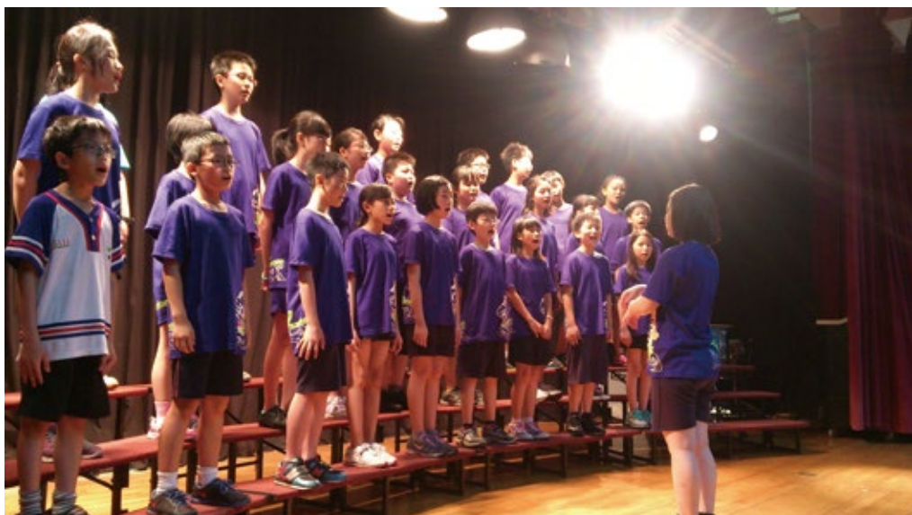
2 五年級合唱練習