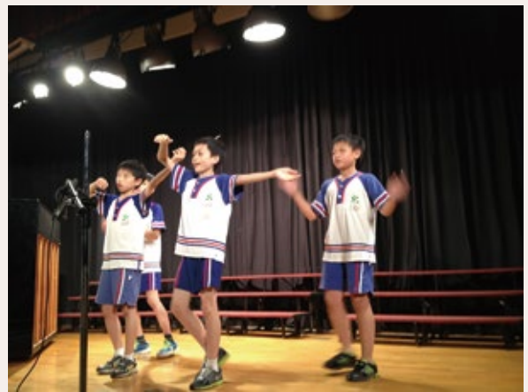
5 小組節目練習

還需負責比賽訓練等校內相關支援活動。若能將課程重新規劃與設計，把學生歷年所學的內容稍加變化，將會是雅俗共賞的好節目，不僅學生容易學，老師也能展現專業，主管也很滿意，家長也看得過癮。