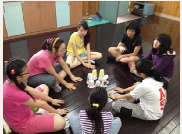
6 小組課堂練習