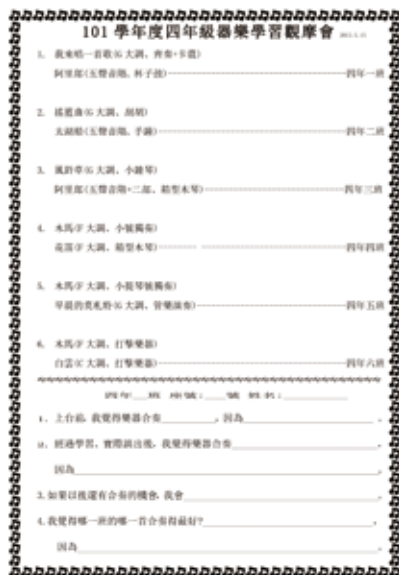
1 學習單