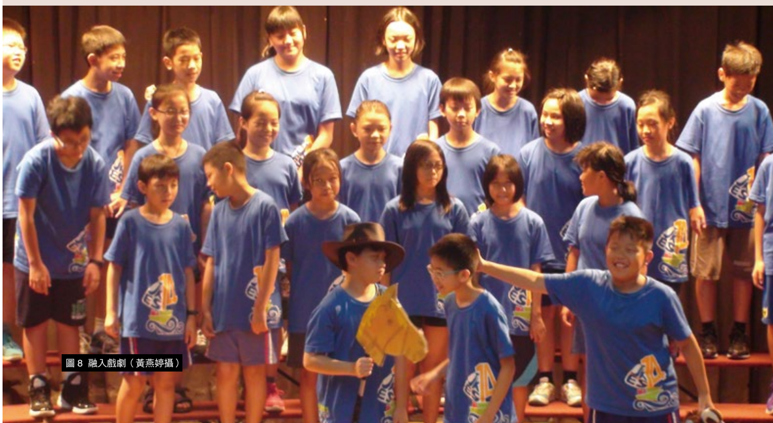
圖 8 融入戲劇