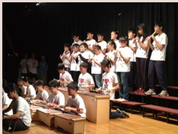
4 班群節目練習

五年級合唱觀摩會中，教師亦讓學生開始嘗試伴奏及指揮，許多學生在家有學習器樂的個人經驗，但要擔任伴奏的角色時，學生也從此習得另一種合奏的經驗。指揮由學生擔任，教師除了希望能先於六年級畢業音樂會時，讓學生有獨立完成節目的基石，學生擔任指揮的角色，也可訓練自己內在速度的穩定性：