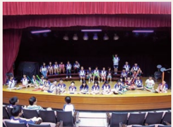
7 班群組合練習