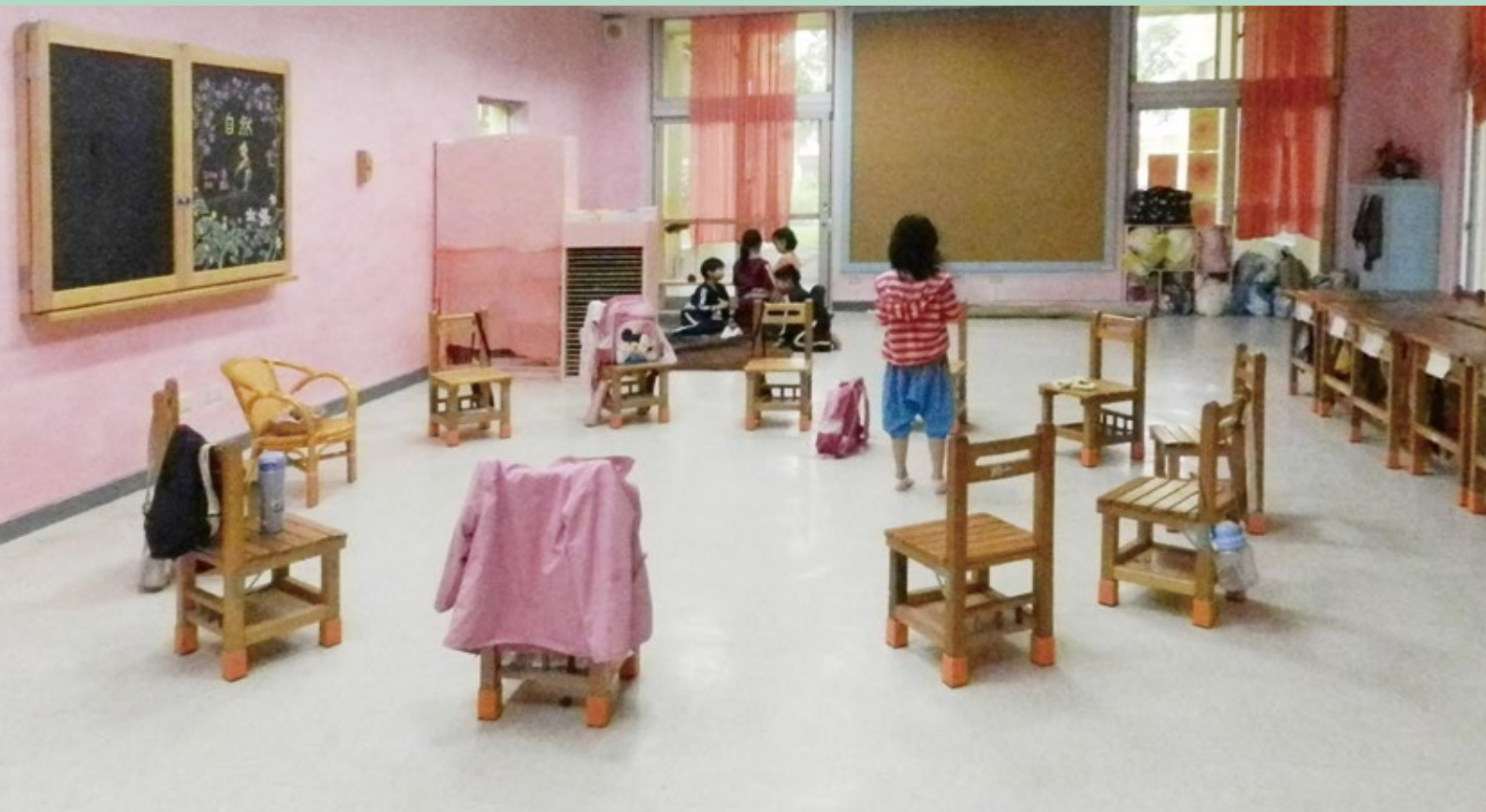
1 淡粉紅色的教室營造出溫柔的氣氛，除了黑板、課桌椅與收納櫃，教室中並無過多的擺設與裝飾，顯現出簡單、柔和而樸素的空間品味。