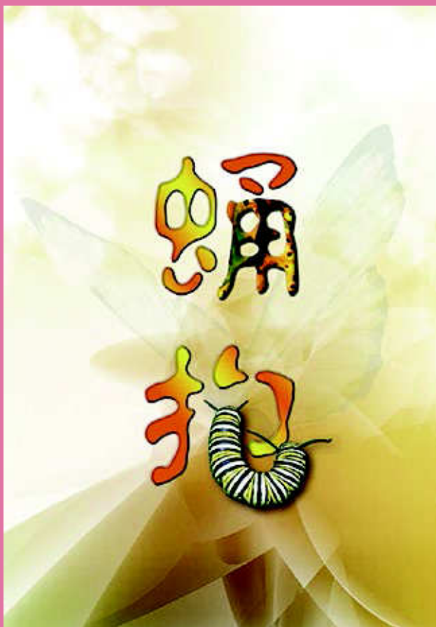
【擁抱 X 蛹抱】