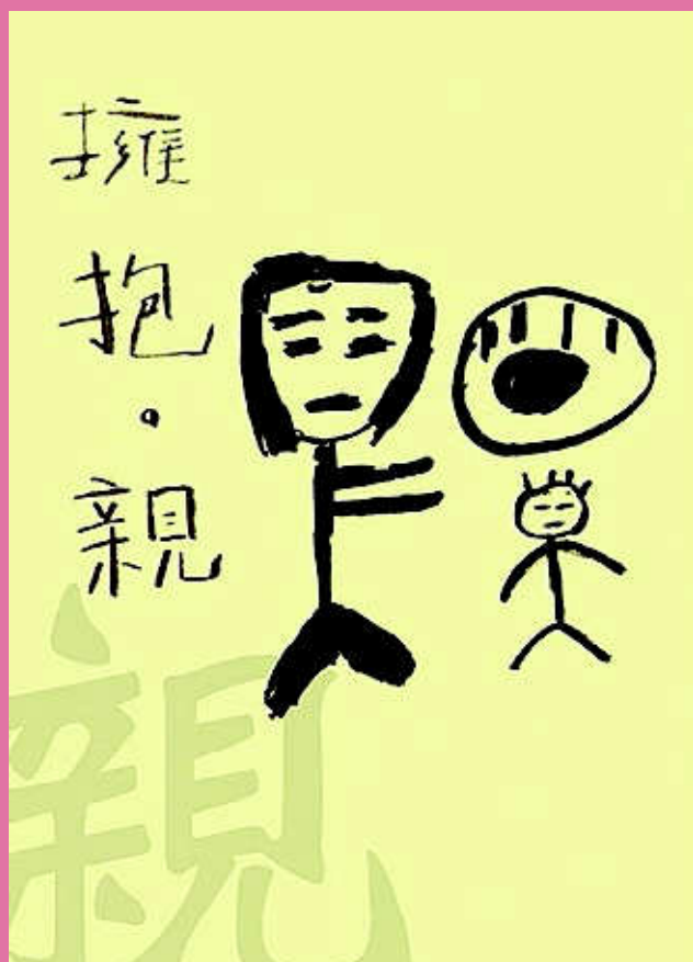
【擁抱 X 親】