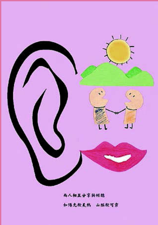
【擁抱 X 陪】