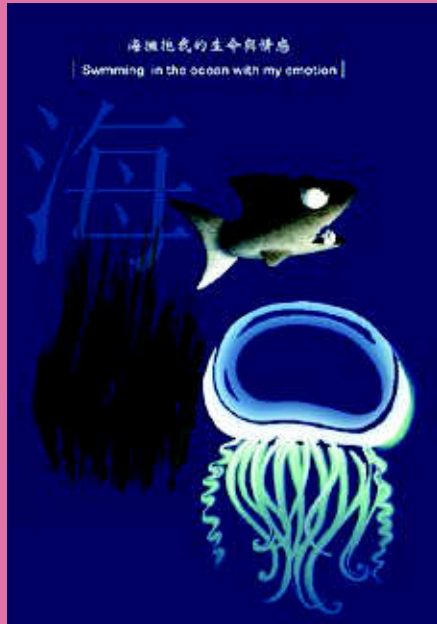
【擁抱 X 海】