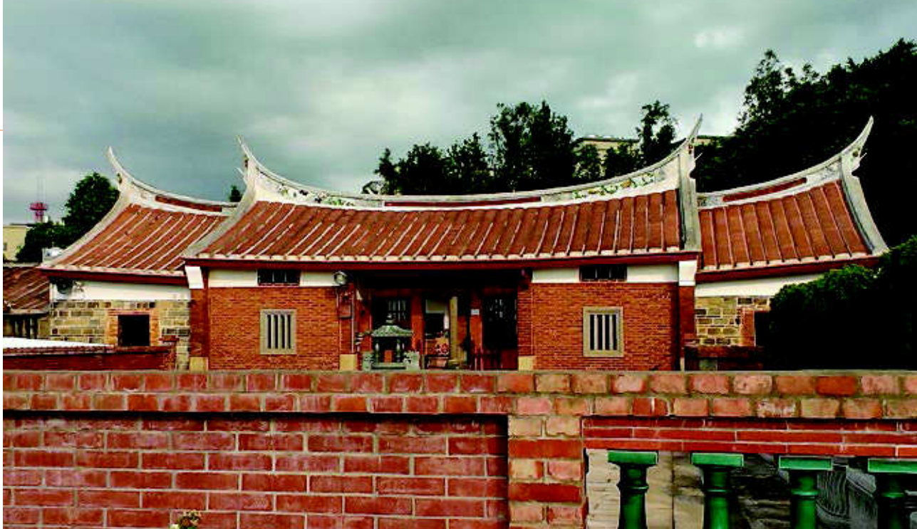
11 燕子尾巴造型的燕尾 2014

色之網格、紅色網格兩側白色長方塊狀、上下兩道白色之紋路及其深藍之底色，加之屋後整片綠意竹林、水藍天空之襯托，大概可以推測在早期民居當中，應是當時較為華麗而典雅的建築，帶有樸實又高貴之氣質。