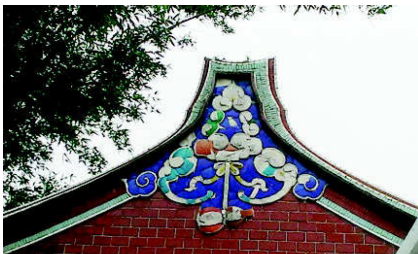
圖 8 為花籃式懸魚，相傳有一典故，是因范姜在當地是大戶，擁有許多田地，因而將田地租給許多的佃農來耕種，范姜姓氏非常照顧那些佃農，佃農也很感謝范姜姓氏，在過年過節時，因佃農窮

圖 7 與圖 8 同為位於桃園新屋鄉范姜古厝第三幢的一對懸魚，其懸魚造型在其五幢古厝當中是相當獨具特色的，因懸魚常為富貴人家的象徵，或認為在五幢古厝當中，第三幢建築則具華麗的特色。圖 7 懸掛的是錢幣，象徵財源滾滾，錢幣兩側之乳白色半浮雕式紋雲弧線與襯底之紅磚搭配，則更顯造型之生動。鳥踏即在懸魚之下突出之橫線部分，橫跨整面山牆。