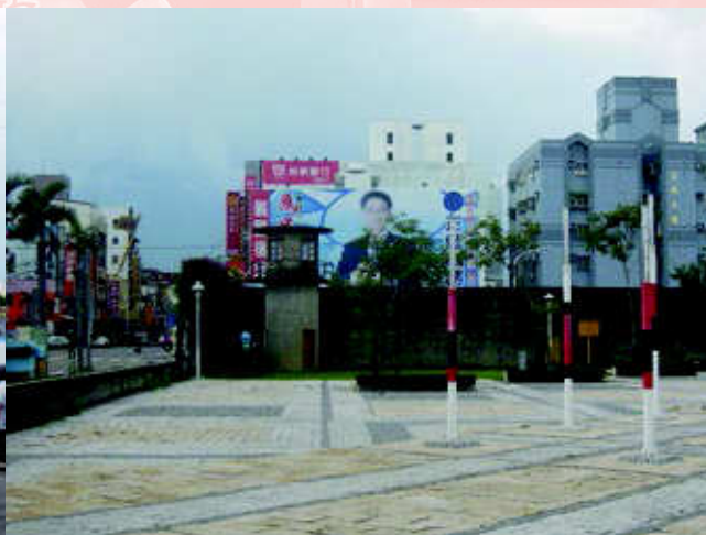
1 政治競選廣告的肖像，是一種視覺的虛擬「表演」，日日與公眾在各個城鎮相遇。再且，廣告看板的生產機制充滿不平等，誰有錢有勢誰就能先占位置，卻也揭露了「沒有公平的選舉」的真義。