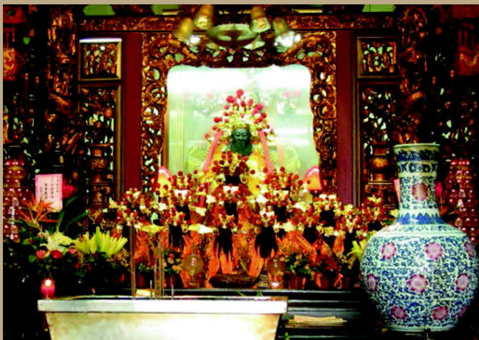
3 正殿神龕主祀之黑面軟身城隍爺位居金字塔頂端，亦為出巡用之分身，最後方最大者則為鎮殿粉面城隍爺。神龕「飛罩」雕有花草及螭虎圖案，左右兩邊各有一對有龍柱及瓶花人物木雕。整座廟內所有神桌上都是梯形長方體金屬製的香爐，沒有任何的裝飾，予人簡潔、明快的印象。（余宥嫻攝）

基隆城隍廟正殿神龕中，鎮殿的神尊為最後方最高的泥塑粉面城隍爺神像，其前軟身黑面的城隍爺神像為出巡時的分身，最前方則有數尊較小型的黑面木造之城隍爺神像分身，神龕內清一色是城隍爺。面對神龕，可發現神像群的排列方式為：從前到後採由小到大的漸層之美，整體呈正三角形，讓正殿看起來更加穩重與莊嚴。（圖3）