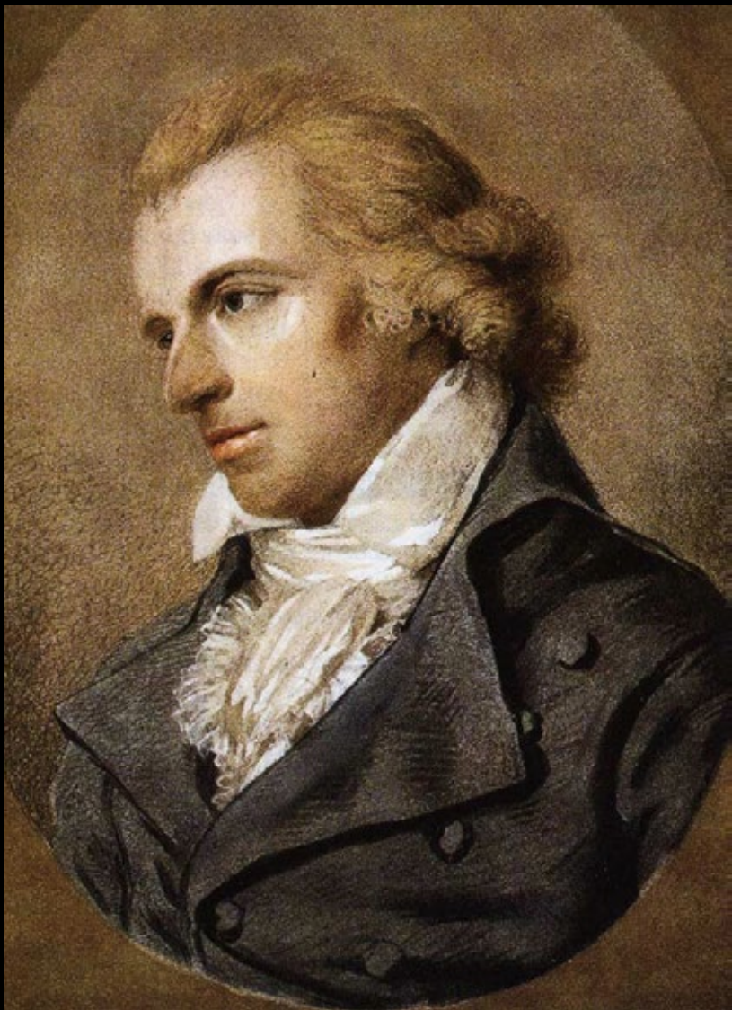
1 Ludovike Simanowiz,「席勒肖像」, 1793-1794。

關於美感教育，我們有教育部核定一期五年的計畫（台灣・好美～美感從幼開始、美力終身學，2014-2018），也有許多關於美感教育的討論，但事實上，這仍是一個看似清楚實則模糊的概念，因為我們只看得到目標，卻還在摸索前進中了解確切的步調與方向。美感教育通譯為 Aesthetic Education，也就是更常被理解的「審美教育」或是「美育」。這個名詞最早可追溯至德國詩人席勒（F. Schiller, 1759-1805）（圖 1、2）於 1795 年所寫的《審美教育書簡》（ Briefe über die ästhetische Erziehung des Menschen ） 1 （圖 3），然而，對美的討論與思考，卻早在古希臘羅馬時代的哲學思辨中就已經慢慢成形。從柏拉圖到亞里斯多德，美的現象一直是他們思辨人生的重要議題之一，如在《大