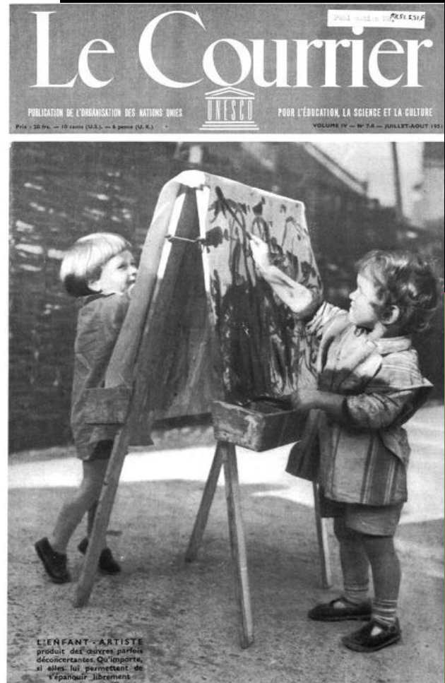
6 聯合國文教組織（UNESCO）通報 N°1951-6 七月／八月號。

1959 年時，文化部長馬侯（André Malraux, 1901-1976）開始許多政策與文化工程，不僅讓文化遺產得以妥善保存以吸引更多民眾了解，同時也有助於活絡藝術環境。像是推廣國際文化活動、修整古蹟、廣設文化中心、建立文化遺產清冊，並鼓勵當下藝術，像是邀請夏卡爾（Marc Chagall, 1887-1985）與馬松（André Masson），分別為巴黎歌劇院和 Odéon 劇院之天頂作畫等。對馬侯而言，學校教育的使命乃是為了保存並傳承過去的文化遺產，文化不僅能對抗僵化教育，並且能賦予了這些藝術作品活力與生命。1968 年，一場名為「為了實現新的學校」（Pour une école nouvelle）之研討會，帶來了學術上的發展共識：其認為美育應該從初等教育開始，並向當代藝術敞開，且與藝術家開始聯繫。而且美育也應與其他學科整合，並延伸至校外的文化活動之中。