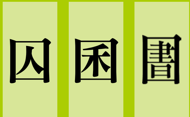
3 會意合體字「囚」和「困」。