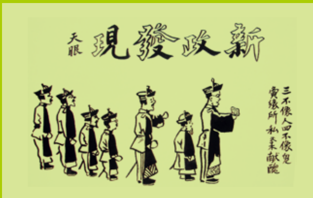
2 藏字詞「新政發現」；「小人又見」。