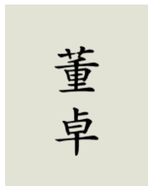
1 猜字歌謠謎底「董卓」。

漢字絕大部分都是合體字的這項特性，也被應用來發展出許多有意思的民間美術、工藝、設計等多種游藝活動或創作，本期就介紹合體字的一些有趣案例。