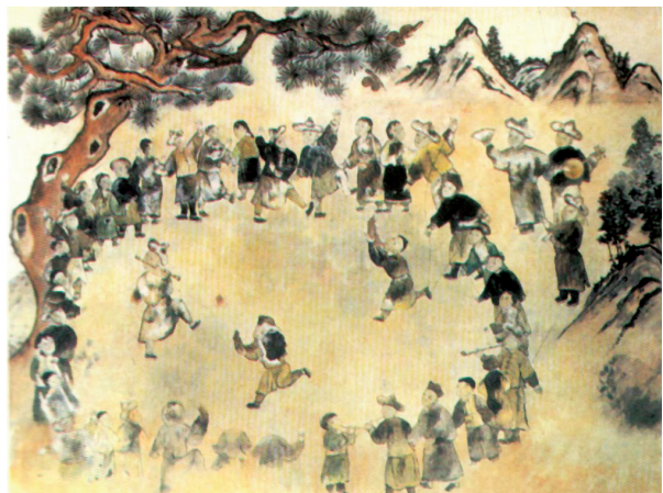
巍寶山彝族踏歌壁畫

在此廟內草叢及亂石堆中尋覓到的「巍寶山文昌宮新建魁神金甲殿碑記」殘碑載云(清·乾隆)：「二十四年，得同志鼓舞，積累募化，鑲砌龍池，建修亭閣東西兩耳口(六行)截至八年，二閣始建，大殿煥然一新。四十年七月(西元一七七五年)，內得善士徐鄭歐口(七行)人而後功成也耶。至繪事壯修，又必待起而繼之……。」由此可見，這幅踏歌壁畫距今已有二百二十多年的歷史。縱觀這幅踏歌壁畫，筆法細膩流暢，色彩對比鮮明，構圖自然淳樸，人物大方端莊，舞姿剛柔相濟，神態生動逼真，情景交融。整個舞蹈場面氣勢宏大，結構嚴謹，歌舞樂互為呼應。粗獷豪放而熱情洋溢的古代彝族踏歌舞蹈場景，使觀賞者如身臨其境，如聞其聲。壁畫上古代彝族舞蹈家們騰躍如火的舞姿。強烈的生命律動給人以一種勢欲破壁而出的真實感。