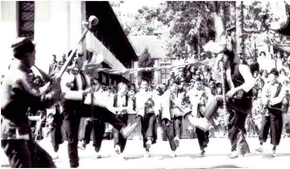
巍寶山「打歌山」的彝族踏歌(石裕祖攝)