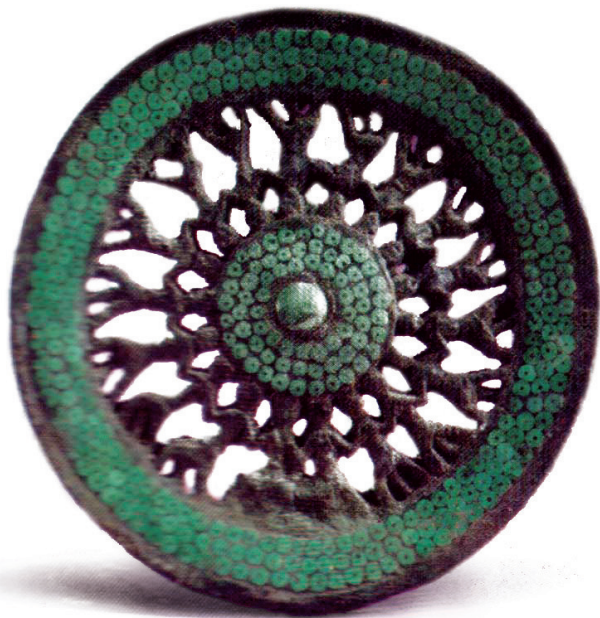
李家山青銅器扣飾「圓形舞蹈」

本文作者石教授與筆者曾經多次赴巍寶山的前山至後山進行實地田野考察，並走訪了當地大量彝族群眾。經過反覆進行考察研究後確認：本文討論的這幅彝族踏歌壁畫乃是西南地區稀有的古代彝族傳統舞蹈珍貴文物形象資料，結合現存彝族踏歌原生形態和變異形態的研究，對追溯古代彝族傳統舞蹈的歷史文化背景及發展變化規律具有補遺證史的作用。