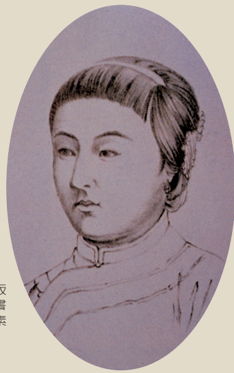
光緒年間出版的圖畫教科書之鉛筆人像素描範圍