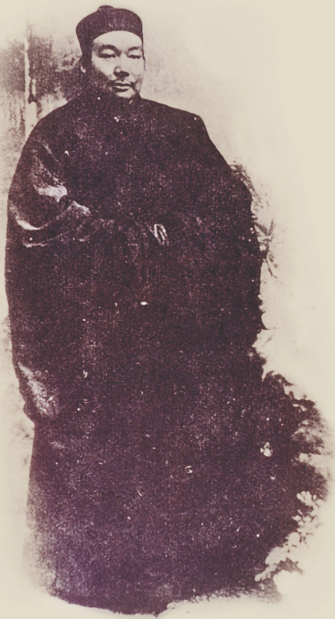
兩江優級師範監督李瑞清之像

癸卯學制頒布施行之後，由於圖畫、手工兩科目都是新課程，各級學校缺乏師資之問題頗為嚴重。因此，滿清政府當局遂於師範學堂增設圖畫手工選科，以因應師資缺乏之補救措施。就