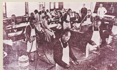
下:兩江師範學堂金工實習