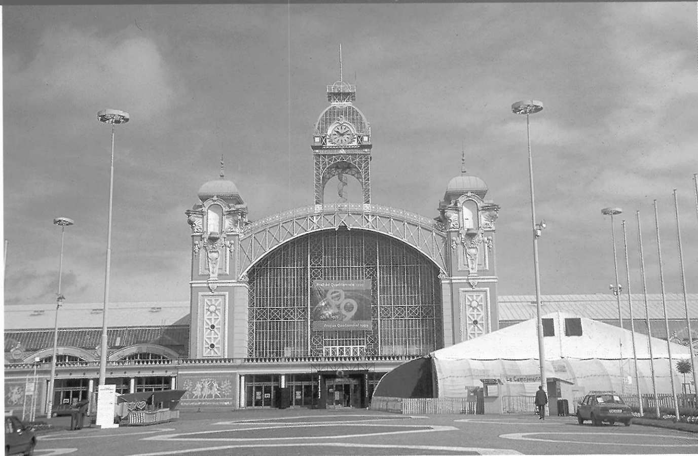
■對於專業的劇場工作者而言，布拉格的魅力則是一種週期性的現象——布拉格四年展（PRAGUE QUADRENNIAL，簡稱PQ），圖為PQ99舉辦的地點：布拉格工業宮。

如果我們稍微追溯——下PQ的歷史，我們其實可以發現，對於這些問題的討論及思考，不僅是組織展覽的緣起／動機，更始終存在於整個展覽歷史的核心當中。換言之，PQ的