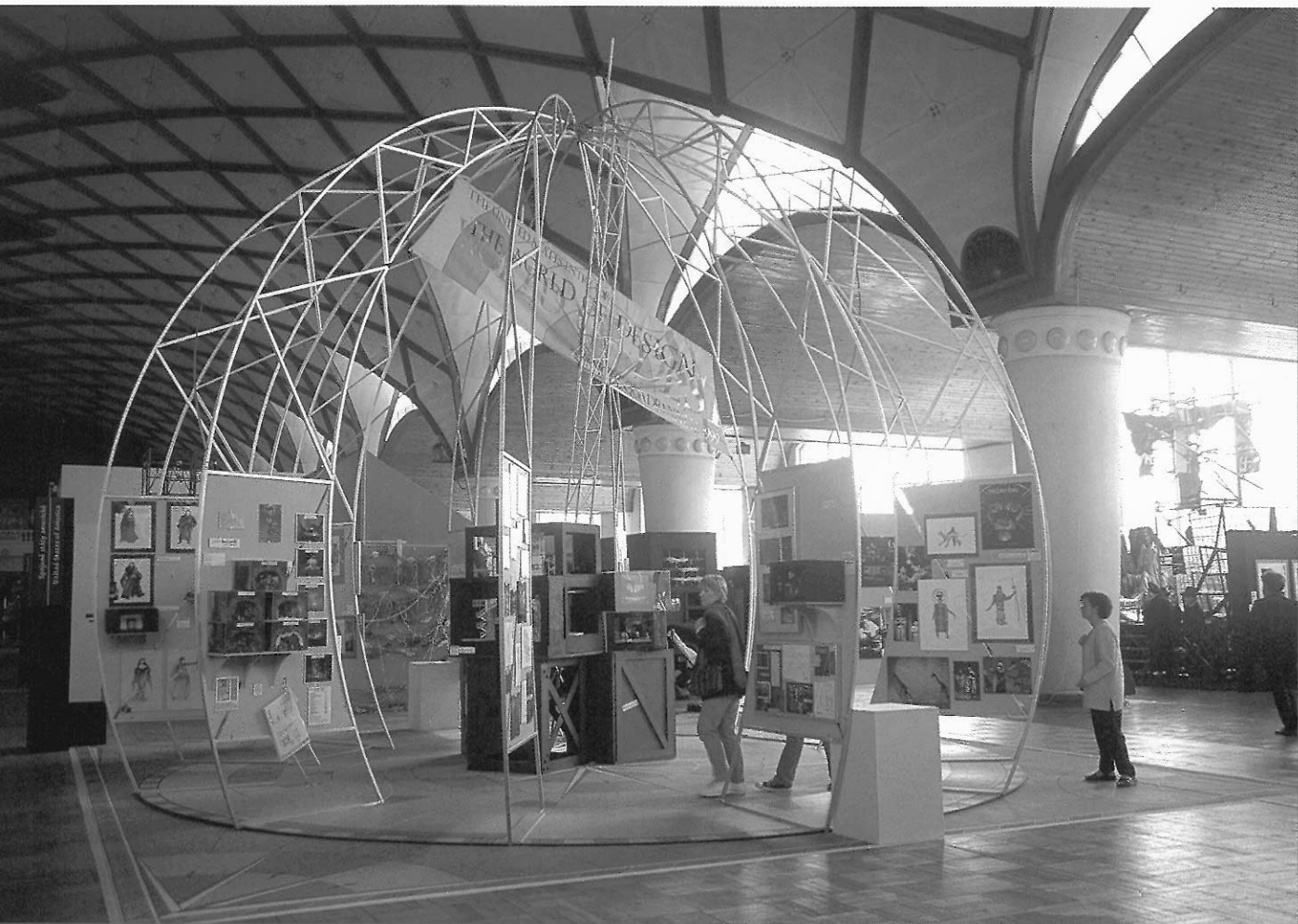
■ 展場的設計反映美國的霸氣，展出的內容卻缺乏風格（美國國家展）。