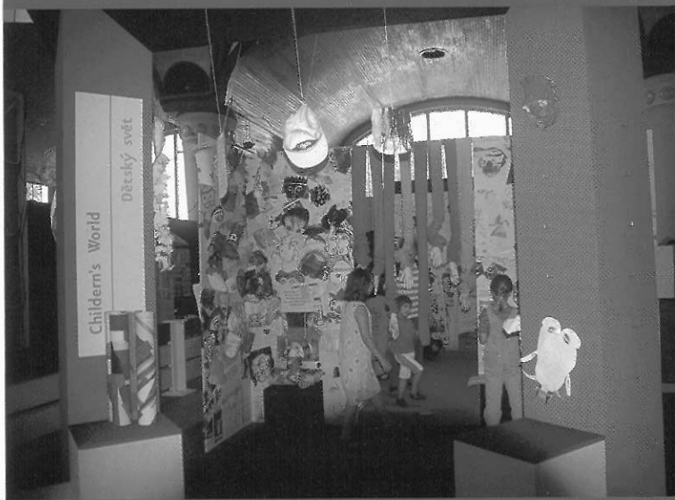
■ 兒童區部份不僅有學童作品的呈現，更提供了戲劇服裝與簡單的道具供孩童體驗戲劇創作的樂趣。

性的探討。此外，配合今年的 PQ 建築展的主題，OISTAT 也同時舉辦了第五屆國際劇場建築競圖，主題是 "1999 布拉格世界劇場 (World Theatre in Prague 1999)"，總共吸引了 30 個國家的 226 件作品。從建築展和競圖的得獎作品來看，無論是新建、改造(舊的劇場空間或原為其他用途的場地)、或者對未來的想像，關於劇場功能性的考量、周圍空間的結合運用、觀眾與舞台關係的思考，依舊是劇場建築的核心問題。而更重要的是，從過去幾屆的 PQ 建築展來看，建築師、劇場設計/工作者、和觀眾在劇場建築理念發展的過程中，似乎一直保持著一個相當緊張的關係，而從今年的許多作品來看，觀眾的地位與影響似乎有日趨重要的趨勢，換言之