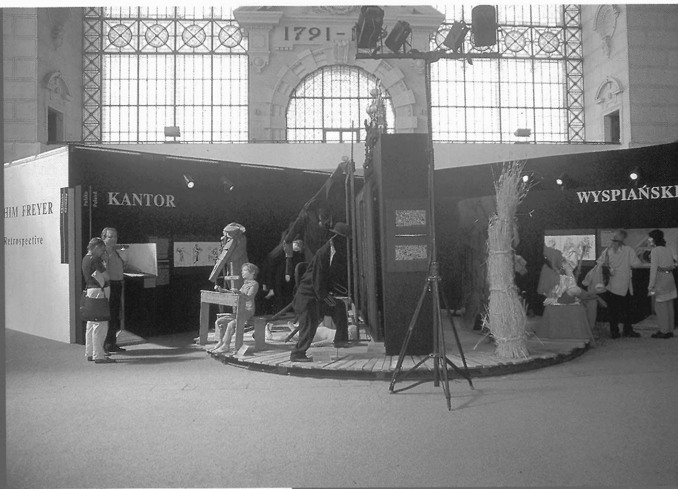
■ 波蘭在主題展所選擇的設計家 Wyspianski 與 Kantor，跨越了整個二十世紀。

性的探討。此外，配合今年的 PQ 建築展的主題，OISTAT 也同時舉辦了第五屆國際劇場建築競圖，主題是 "1999 布拉格世界劇場 (World Theatre in Prague 1999)"，總共吸引了 30 個國家的 226 件作品。從建築展和競圖的得獎作品來看，無論是新建、改造(舊的劇場空間或原為其他用途的場地)、或者對未來的想像，關於劇場功能性的考量、周圍空間的結合運用、觀眾與舞台關係的思考，依舊是劇場建築的核心問題。而更重要的是，從過去幾屆的 PQ 建築展來看，建築師、劇場設計/工作者、和觀眾在劇場建築理念發展的過程中，似乎一直保持著一個相當緊張的關係，而從今年的許多作品來看，觀眾的地位與影響似乎有日趨重要的趨勢，換言之