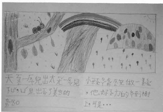
■ 毛毛蟲過河（周煒的第一本手製繪本）