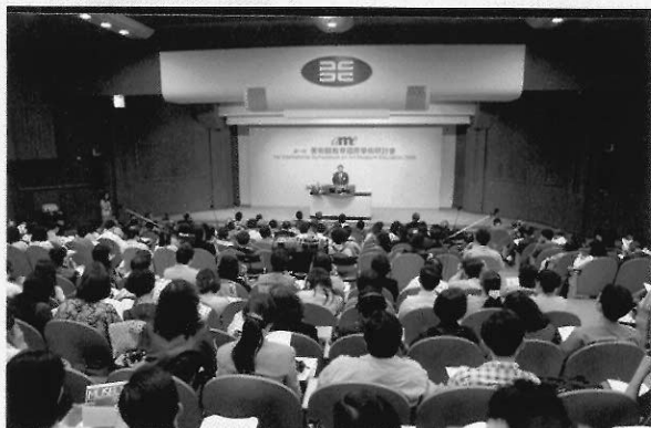
▲教育部社教司司長致辭