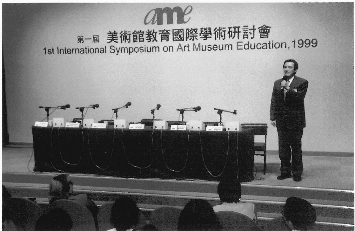
▲臺北馬英九市長，暢談紐約、波士頓參觀美術館之經驗。

如是說。林曼麗館長也在為期兩天的「第一屆美術館教育國際學術研討會」開幕中宣示：「台灣已經進入美術館時代，其他主題館亦紛紛成立，所以博物館不再是精英人士所享有，而是廣大人民所能享有的。藝術的存在是因人而產生『光』與『熱』及『生命性』。讓我們回歸原點，就美術館與人之關係作一思考，共同開啓博物館的新紀元。」