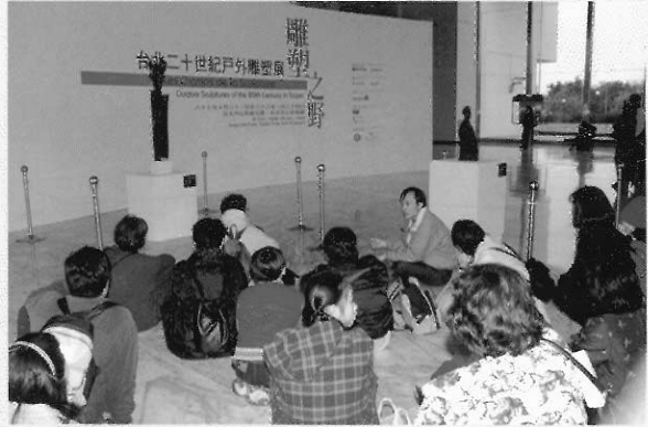
▲美術教師們席地而坐一同參與「雕塑之野」培育導覽教師培訓課程。

最後主持人高雄市立美術館館長黃才郎，在「高雄市立美術館資源教室案例探討」中，提出他個人的經驗：高美館整合起社區與美術館本身的藝術資源，於開館之初即著手規畫全國首創的「資源教室」。相較於其他的展示，「資源教室」的目的即以教育為依歸，透過美術館教育人員的轉換與詮