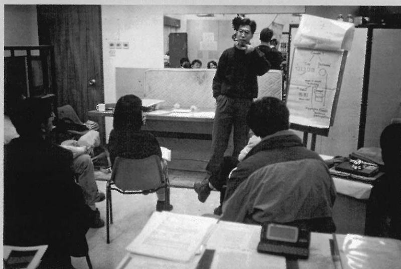
▲老師學員們輪流向其它學員匯報其專題教學計劃的構思，互相切磋。

三年兼讀課程的最後一年就在這樣的要求下結束，學員畢業後除了擁有一些相關的基礎知識、一種自學態度和一個學位外，最重要的還是擁有一個完全屬於自己或只有自己最為專長的教學計劃。這點對於我所提倡的師訓模式是相當重要的。下面再談。