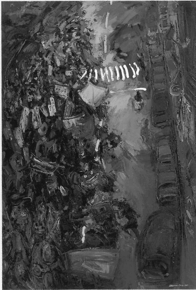
▲迎神遊街 施並錫 油畫 1997年 194x130cm

意識的建設。並透過自己的美學判斷、審美活動把理想在大眾、社會裡、土地上落實，充份發揮藝術的社會功能。