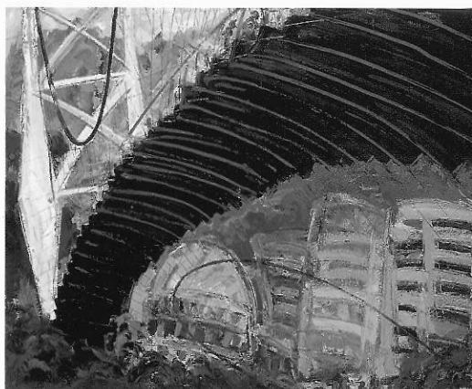
▲溝通 油畫 100F

台灣自一九八七年解嚴以後，歷經十數年變遷的陣痛，台灣社會逐漸邁向強大包容性、多元化的新時代及大未來。在民主化與現代化、國際化與本土化（全球本土化）的渴求吶喊聲中，今日，藝術家已掙脫了長期的心靈桎梏。上窮碧落