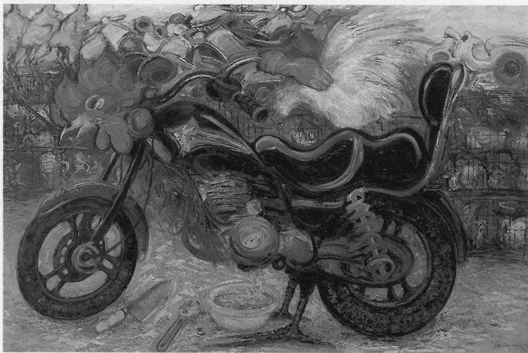
▲雞車物語 施並錫 油畫 1995年 240x160cm

藝術創作本是藝術家的生命展現。雖然是個人追求卓越藝術性表現的精神作業，亦需兼顧社會意義，兼顧社會使命。藝術創作與人群、土地、社會及歷史有著極密切的關係。藝術也是大眾精神的寄託處、心靈的守護神、希望的領航員。藝術家的使命就是創造偉大的典型，並留下時代、歷史之見證。誠如李登輝總統於一九九五年二月十九日的「新春文薈」活動中致詞時指出：「藝術是人類文明發展的動力，對歷史、社會、個人，都有不容忽視的影響和貢獻。」(5) 李總統在該大會之致詞內容摘要如下：(6)