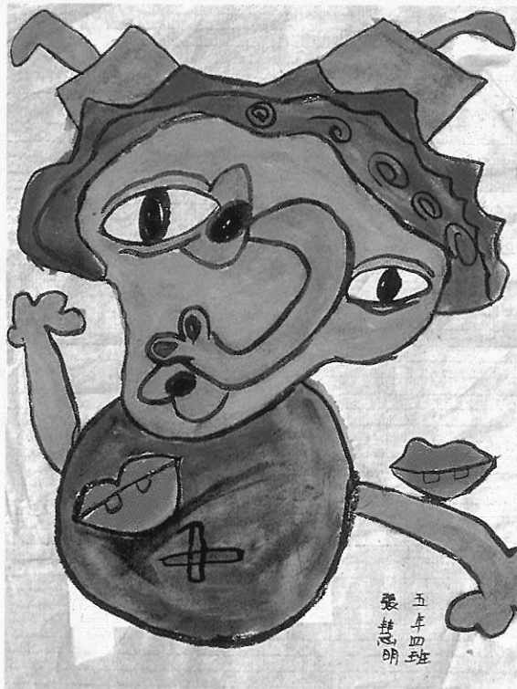
▲林園國小五年級 張慧明所畫「萬能者」 其創作動機來自畢卡索「女人的臉」，再用彩墨自在地表現