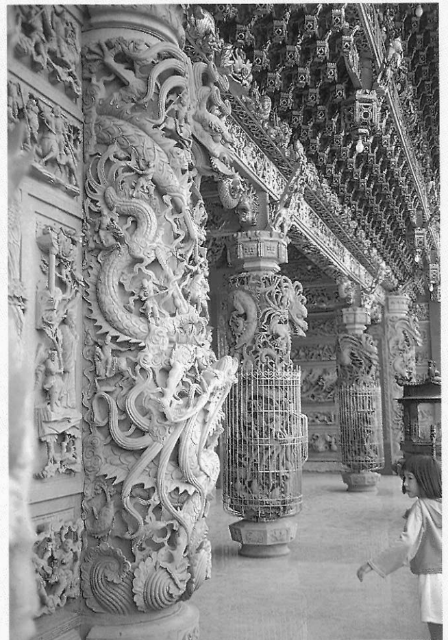
▲鳳山龍成宮的龍柱 龍是十二種物特徵的合成動物，可作為創作的參考

一般而言，教育工作者應該也是教學研究者，以確保教育專業水準；教學研究也是教育專業知能的典型表現。近年來，課程發展機構或師資培育機構，常以協同方式與國中小學教師從事教學研究，這種方式的研究，一方面可驗證理論或初步課程，另一方則可教學相長，並累積研究經驗。筆者曾主持之「創意美勞」教學研究，即應用協同方式，以探討「創意美勞」的實施方案之可行性，並透過教學研究，修訂原設計方案（黃壬來，民85）。此外，教育部委託屏師美教系的「鄉土美勞教材教法研究」計畫，亦採協同方式，以分析鄉土美勞教學的理念、教材內容與教學方法，並探討鄉土教材的編選與教學實施的模式，做為國小教學之參考（陳朝平、黃壬來，民85）。