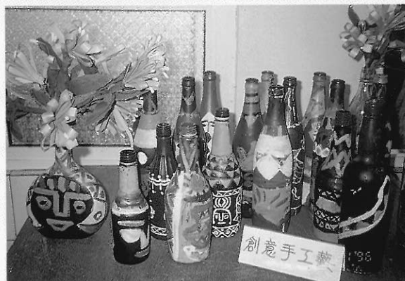
▲屏東縣青山國小學生的瓶罐彩繪 該校的鄉土教育活動之一，係應用傳統圖騰於現代生活器物的美化