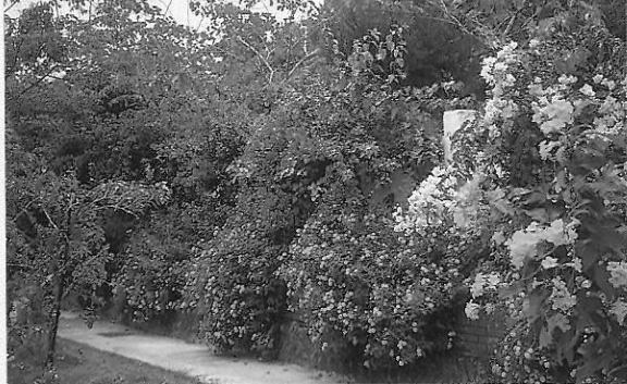
▲高雄縣金竹國小校園綠化美化一景 該校的鄉土教育係以學校生活環境的經營為重點