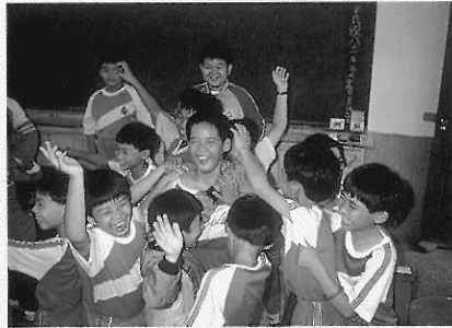
▲高雄縣林園國小四年級學生演出「理想中的學校」創作前的即興式虛擬實境