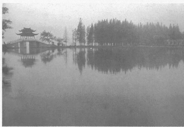
▲杭州西湖映成趣的美景 觀賞者的審美反應可為靜觀、遐想或瞬間的整體感受

下休止符。現行國小美勞課程標準，係根據 DBAE (Discipline-Based Art Education, 學科本位的藝術教育) 形式的視覺藝術教育結構，採行統一性與鄉土性的雙軌制教材，邏輯可稱清晰，並有意整合工具論與本質論的理念；惟該標準仍有目標未具連貫性、教材內容分項未臻完整、部分教材過於理想化、忽略視覺藝術的不可預期性與個別性，以及學習評量之用語欠妥等問題，易言之，該標準之內涵有未經充分專業諮詢之缺憾（詳見黃壬來，民 87）。