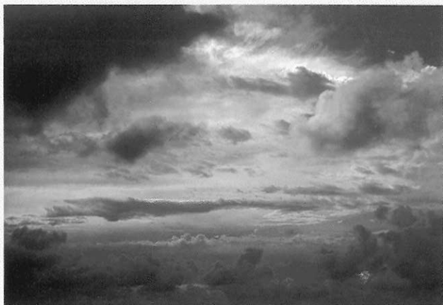
▲屏東某日午後的天空 觀賞者的審美反應可為靜觀、遐想或瞬間的整體感受