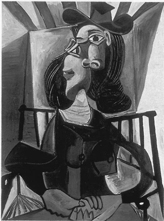
▲畢卡索所畫「女人的臉」 這張畫提供國小高年級兒童欣賞多重視點的處理