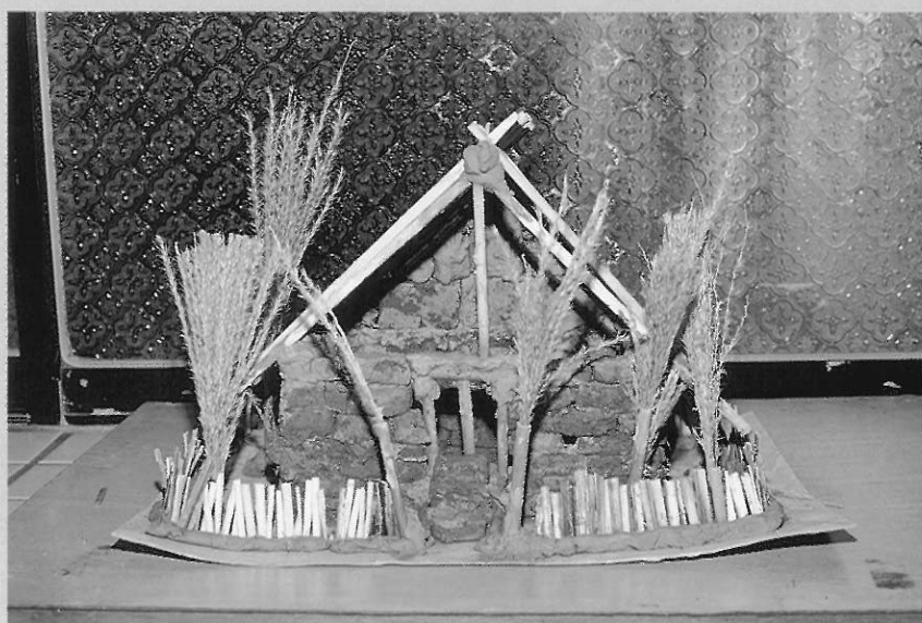
▲淡水水源國小四年級小朋友，透過實際鄉土建築考察後，應用當地的蘆葦草、紅土塊，所作的延伸創作。

文化與外來文化之特質，進而達到民族文化的維護與發揚之效果；並藉藝術品的溝通，促進世界大同文化的形成。