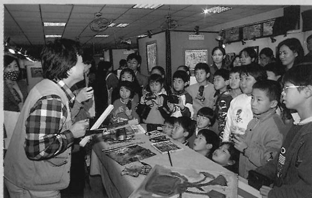
▲透過生動有趣的導賞策略和創作示範，將有助於美術館功能的推廣。