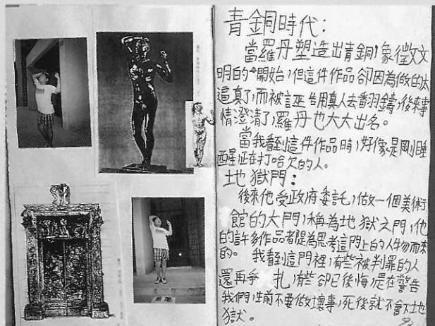
▲在參觀完羅丹彫塑大展後，台北市敦化國小五年級小朋友，結合肢體模仿體驗，所發展出來的學習筆記和攝影照片。