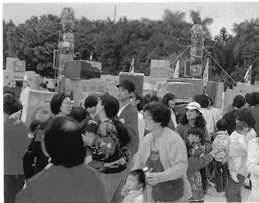
▲以創意的藝術嘉年華取代傳統吃吃喝喝的園遊會，更能提昇休閒生活品質。

相信台灣島上所有的現住民，其勤勞、拼命、生產的最終目標，絕對不是要當一個「住在垃圾之島