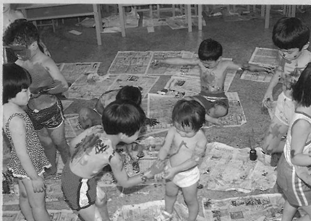
▲透過紋身遊戲體驗開放與創造性的造形樂趣，將是幼兒發展過程中不可或缺的重要課程。