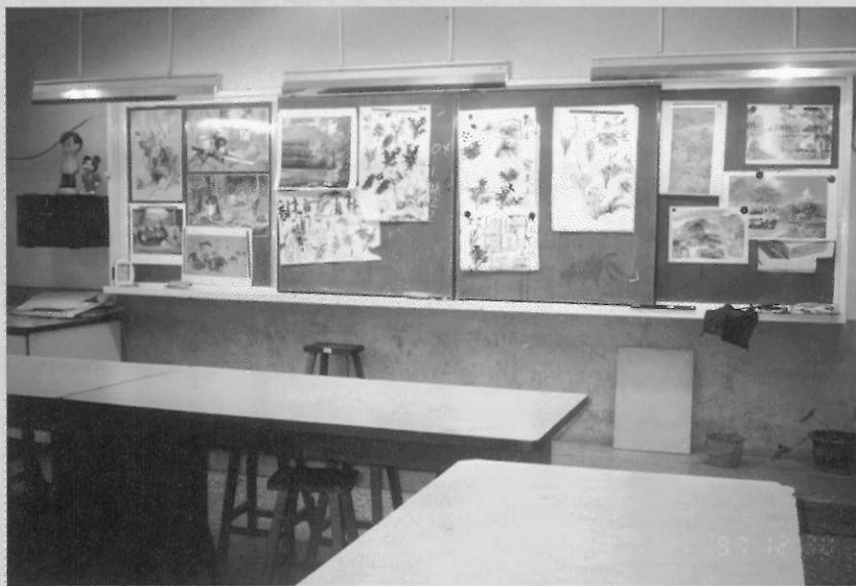
▲圖一 美術老師教導山水畫，張貼於黑板上的教具，除了自製的畫稿外，也包括從月曆上剪下的風景圖片及名畫複製品。