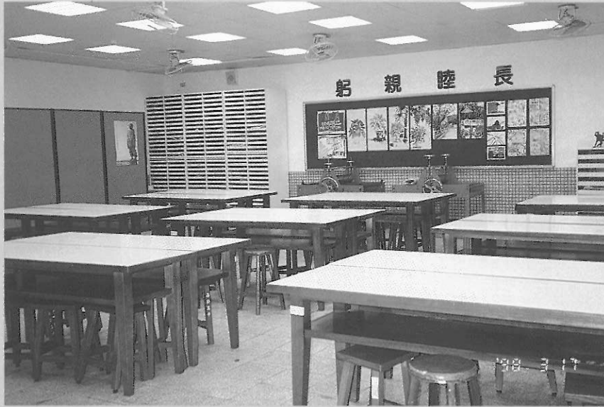
▲圖三 美術班教室比一般美術教室具有較多設備