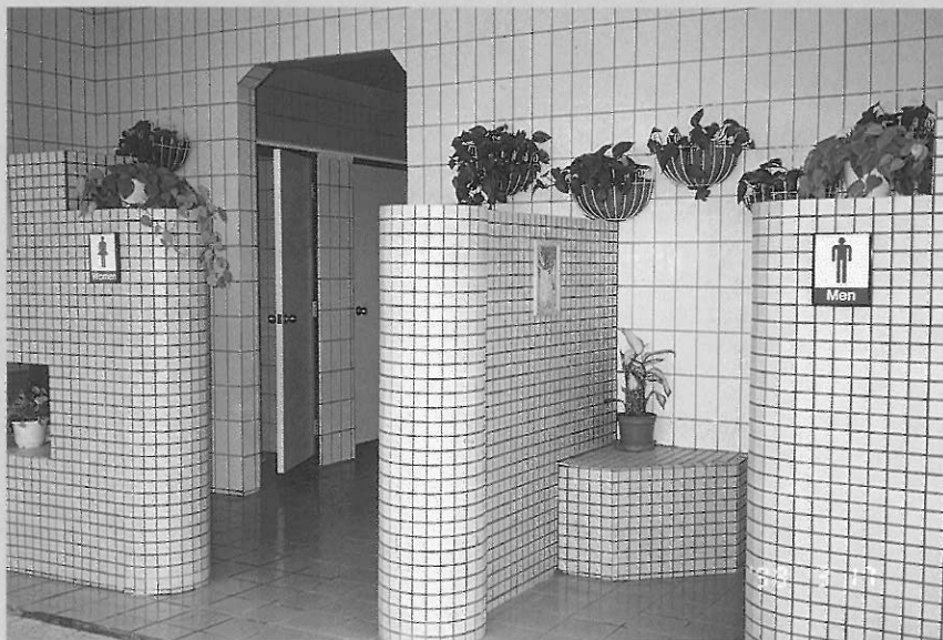
▲圖四 西松高中經美化後的廁所，予人整潔明亮之感受

認為美術可以學以致用、豐富生活、習得不少美術相關知識等。但對要準備美術課的素材及畫具，覺得太麻煩。教師如能幫忙準備部份用具，通常都較受到學生歡迎，課程的進行也會較順利。大部分老師都強調一次不要教太多、太難，否則學生無法吸收；一個步驟接一個步驟講解清楚，讓學生有可遵循之標準；每學期（年）有一、二個教學單元由學生自己決定；多關心學生等。如此一來，師生互動將更好，學生會更喜歡上美術課。