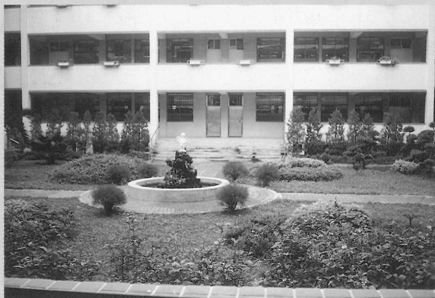
▲圖二 校園也可成為美術教室