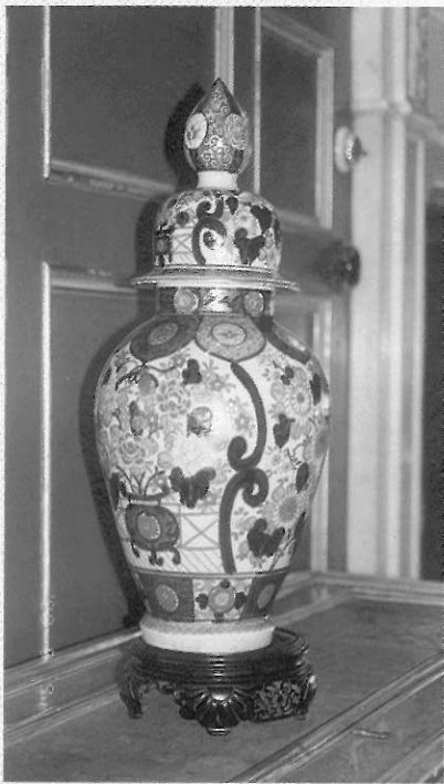
▲圖二 17-18世紀，英國貴族所收藏的伊萬里瓷器（筆者攝於英格蘭華威特城堡（Warwick Castle））