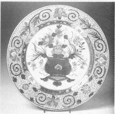
▲圖三 清代生產的「仿伊萬里」風格的外銷瓷

里瓷器並外銷歐洲的能力，並非一夕之功，早在十七世紀的明代萬曆朝開始，中國的彩瓷製作風格，因與日本的貿易往來，而明顯看出受到日本裝飾風格的影響，從歷史的角度來看，日本陶工亟思自行生產高品質的彩瓷，經過實驗與摸索，在一六四〇年代也開始在有田地區（Arita）成功地燒製了釉下珞珈彩瓷，使得中國瓷器的裝飾風格，在逐漸與日本瓷風互動之下，從傳統的淡雅疏闊的繪畫風格，轉變成繁複豔麗的圖案風格。