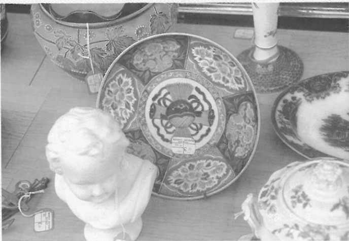
▲圖四 清代由中國民間仿製的伊萬里風格的外銷瓷器，在歐洲地區古董店仍可見到。