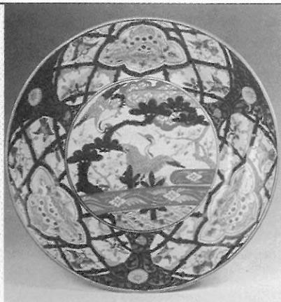
▲圖一 在日本 Arita 生產的伊萬里瓷器(18世紀)

在一七二〇年以後，由於日本實行「鎖國政策」，歐洲與日本的貿易也被嚴格地限制，只允許少數的中國和荷蘭東印度公司的商人在 Nagasaki 灣的 Deshima 島進行海外貿易，使得伊萬里瓷器的價格飛漲；德國只得轉而從荷蘭貿易商處獲取，但是也很難拿到滿意的品類，另一方面，德國梅森瓷廠（Meissen）所製作的瓷器，仍顯得過於蒼白而且無法穩定地控制鈷藍的發色，因此在一七二八年奧古斯都要他的梅森瓷廠（Meissen）開始仿製伊萬里瓷器。逐漸地，荷蘭商人也無法向日本貿易商拿到他們滿意的數量，因此他們也開始在荷蘭的岱爾夫特（Delft）仿製伊萬里瓷器；除此之外，中國看準了歐洲與日本的貿易障礙有利可圖，於是也在一七〇〇年以後的清代乾隆年間，以景德鎮瓷廠為主，以伊萬里瓷器為仿製對象以相類似的紅、藍、金等顏料，生產「伊萬里瓷器式」的中國瓷器（圖三、四）。大量被運銷到荷蘭和英國等地。事實上，景德鎮可以在短時間擁有仿製伊萬