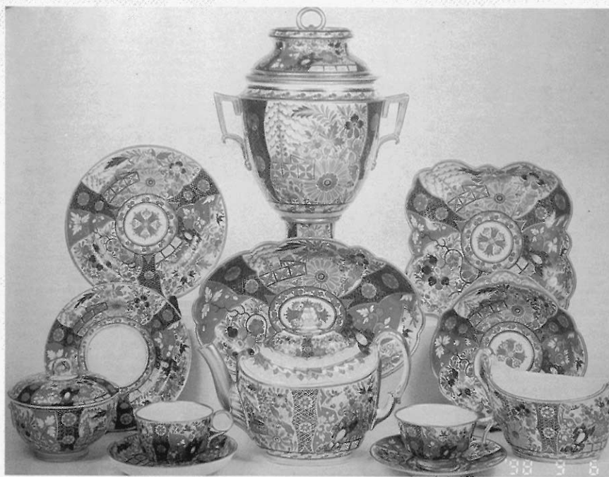
▲圖七 由Worcester所生產「仿伊萬里」風格的整套點心餐具組。