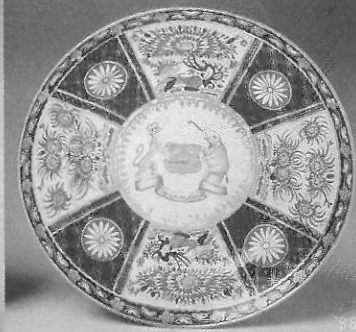
▲圖六 Worcester 瓷廠為一位當時的印度王子，所生產的結合中國與日本「柿右衛門」裝飾風格和歐洲徽章形式的瓷盤。

之時，即藉由韓國陶工之助，以生產釉下青花為起步，在十五到十六世紀間，中國青花瓷器一枝獨秀的時代，有田(Arita)地區的青花瓷器裝飾，不可避免地受到中國青花瓷器相當大的啟發，其後在一六四三年，柿右衛門以進口之中國顏料所創製的「柿右衛門」形式的琺瑯彩瓷，在裝飾手法上自然帶有中國青花瓷器的影響，喜以花鳥為構圖主題，瓷面的整體畫風以簡約取勝而顯得疏闊素雅。