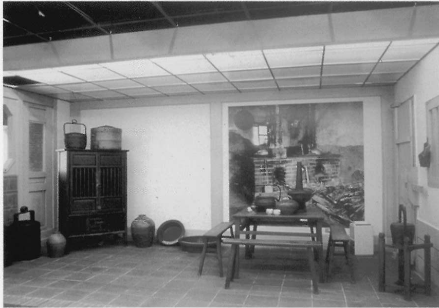
▲圖六 桃園縣立文化中心「傢俱」博物館

圖六），新竹市立文化中心的「玻璃」博物館、南投縣立文化中心的「竹藝」博物館、宜蘭縣立文化中心的臺灣戲劇館（圖七）、實踐管理學院的「服飾博物館」、淡江大學「海事」博物館、雲林縣立文化中心的「臺灣寺廟博物館」、瑞穗博物館（專展貝螺）、嘉義市文化中心的「交趾陶博物館」、臺灣「糖業」博物館、臺南縣菜寮「化石」館、甲仙「化石館」（圖八）、貝汝「陶瓷」藝術館、澎湖雅輪「文石陳列館」。澎湖縣立文化中心的「海洋資源館」，屏東縣立文化中心的「臺灣排灣族服雕刻」館，何創時書法館、後來成立的臺南縣「白河蓮花產業文化」資訊館、坪林「茶葉」博物館、臺北「紙」博物館等專題博物館，凡此等等大有愈來愈茂盛的趨向。而且有些專門博物館的質量，往往是公立博物館所未見或所不及的。