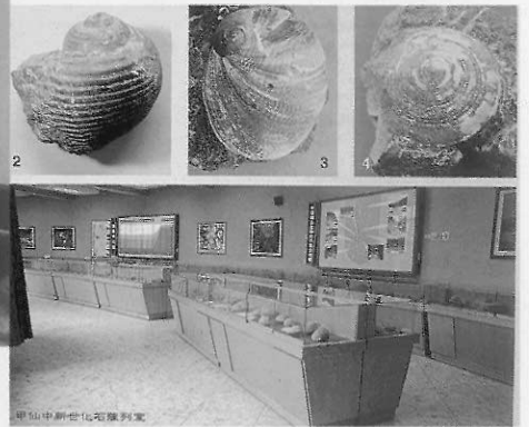
▼圖八 甲仙「化石館」甲仙博物館的化石實物

戶外博物館在東歐最盛行，已有一千餘座(16)，這在歐美早已興起，臺灣在七十年代才出現。