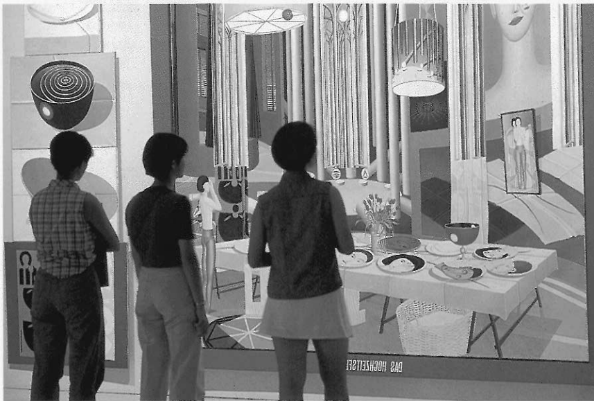
▲圖九 臺北市立美術館展覽會場