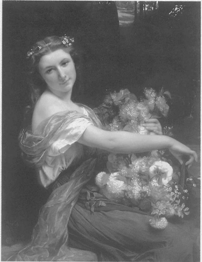
▲圖十一 奇美博物館 奇美博物館的西洋繪畫

七〇年代，外界誤指圓山飯店藏有故宮的文物，故宮博物院遂於民國七十八年七月一日開始總清點，總計六四五七八四件冊無誤。