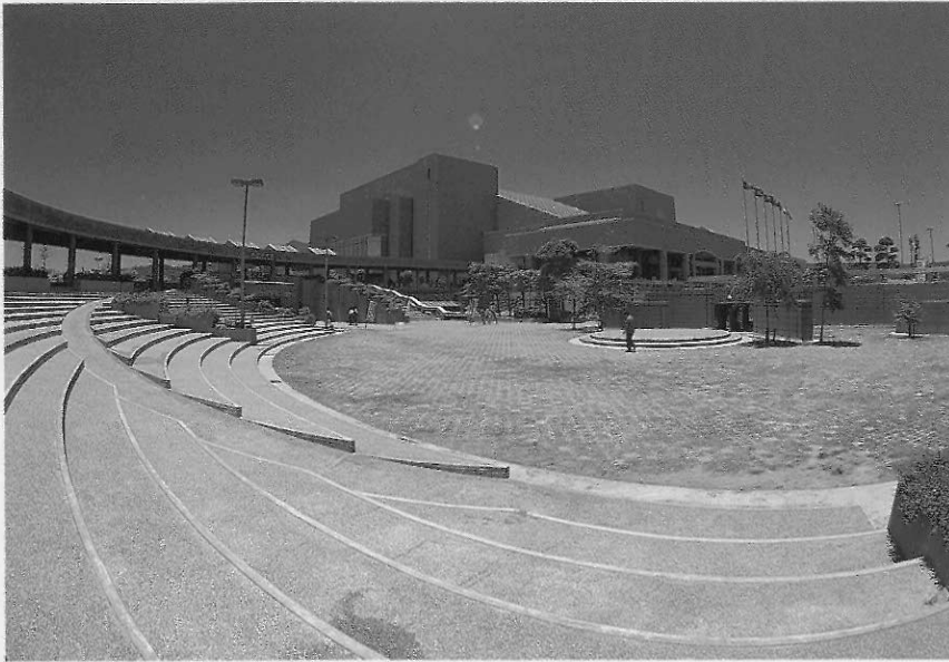
▲圖十六 高雄市立美術館 高雄市立美術館外觀

。規定每人每年交出二篇至少六千字的研究報告，館員因而努力研究，上下翻騰，出版了「歷史文物月刊」、「史物叢刊」和「年報」。黃館長看準兒童是未來的觀眾來源，推行「小雞帶母雞」的策略，策劃許多小朋友的活動，雙親和孩子到歷史博物館參加活動，歷史博物館的觀眾在逐漸增加中。