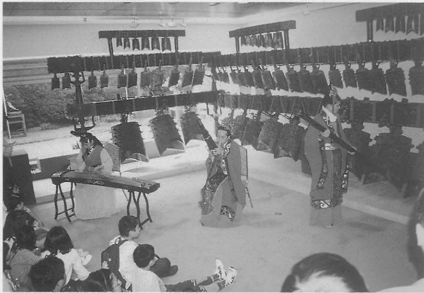
▲圖十五 鴻禧美術館 鴻禧美術館的新藏－曾侯乙墓的複製編鐘