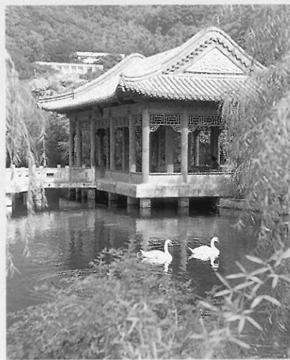
▲圖十四 國立故宮博物院新建至善園 故宮博物院至善園

七〇年代各縣市文化中心雖相繼成立，因發展地方產業是後期的事，一開始並無任何館藏，如何舉辦展覽活動呢？此時歷史博物館的「文物箱」又再次發揮功效。史博館分送文物箱到各縣市中心，成為文化中的第一批產品。到了七十六