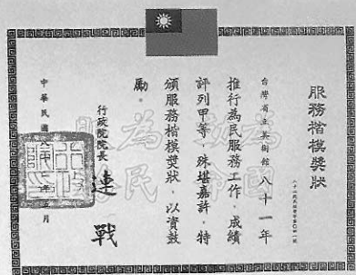
▼圖十 臺灣省立美術館 臺灣省美術館獲得行政院服務楷模獎