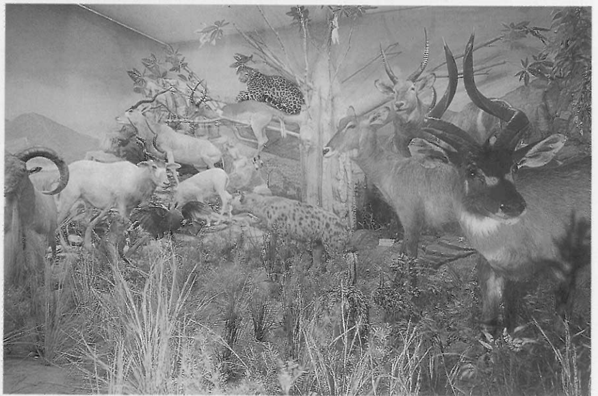
▲圖十二 奇美博物館 奇美博物館的北菲動物標本