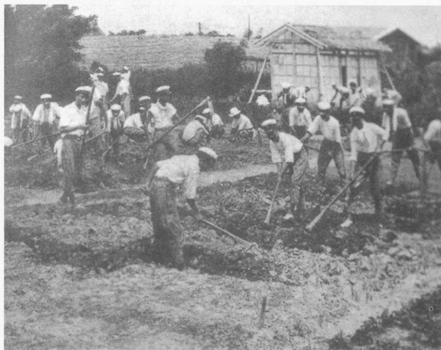
▲ 師範學校農業實習課（約1946年）