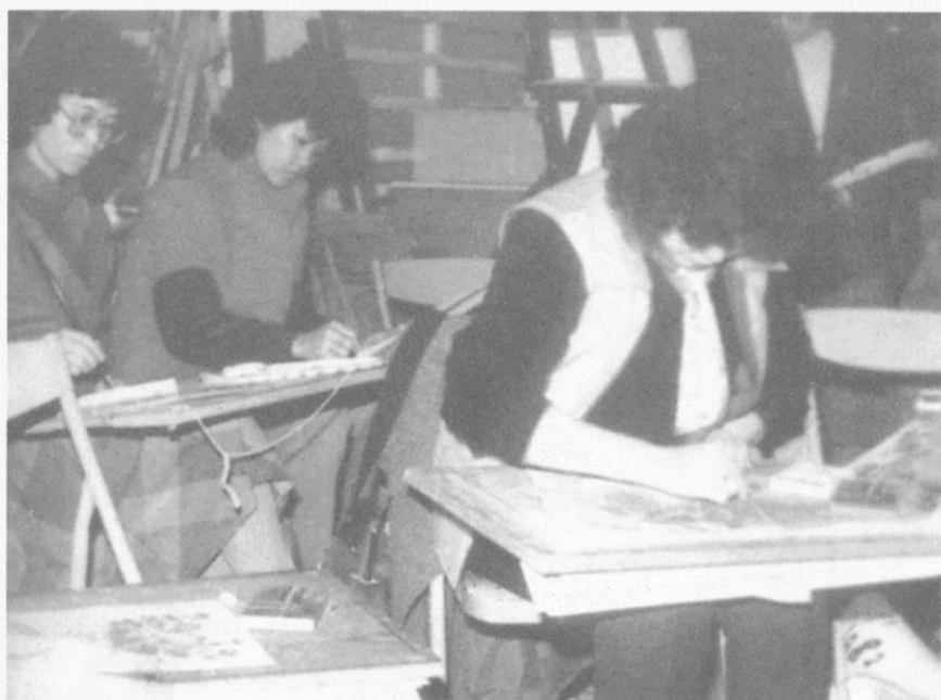
▲ 國小教師美勞新課程研習活動（約1993年）

化、本土化、理論思想與美術教育專業知識的探討以及藝術創作與科技的結合。分別顯示出在高等教育越趨開放的政策下，不同大學所發揮的個別特色以及配合社會文化需求所因應的改變，並強調美術教育與生活的結合。此外，「臺灣美術概論」課程的開設，則反映了目前臺灣社會強調本土化發展的趨勢。