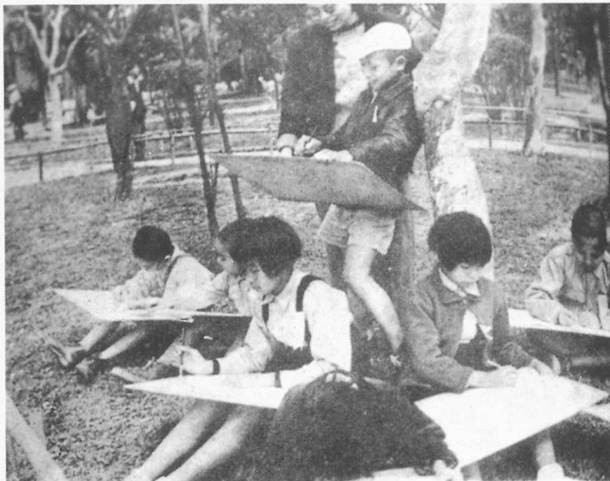
▲ 臺北市第五屆國校兒童寫生比賽（1956·3·27）