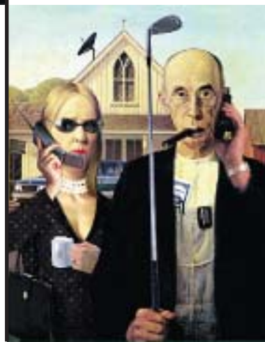
附圖2 商業上一再重複挪用Wood「美國的哥德式」(American Gothic) 成為另外一種意象的作品。

到，事實上哈伯所捕捉到的資料只是黑與白而已 ( http://hubblesite.org/sci.d.tech/behind_the_pictures/ )，顏色是在實驗室裡被一群科學研究團隊，依據現有的和資料庫的資料處理成的。在網頁上由NASA哈伯望遠鏡拍到的圖片 4 來看，一顆老化的星球激起一團混亂，產生許多閃亮的氣體光點，在這近距離的圖片看起來就像是這個啞鈴星雲 (Dumbbell Nebula) 要被撞擊一般。啞鈴星雲是離我們很近的星雲，但仍然距離1,200多光年遠。