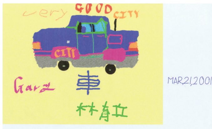
圖23 用電腦畫汽車(育立畫於六歲)