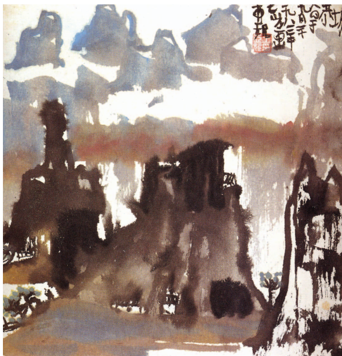
圖12 早春 (亞妮畫於七歲)