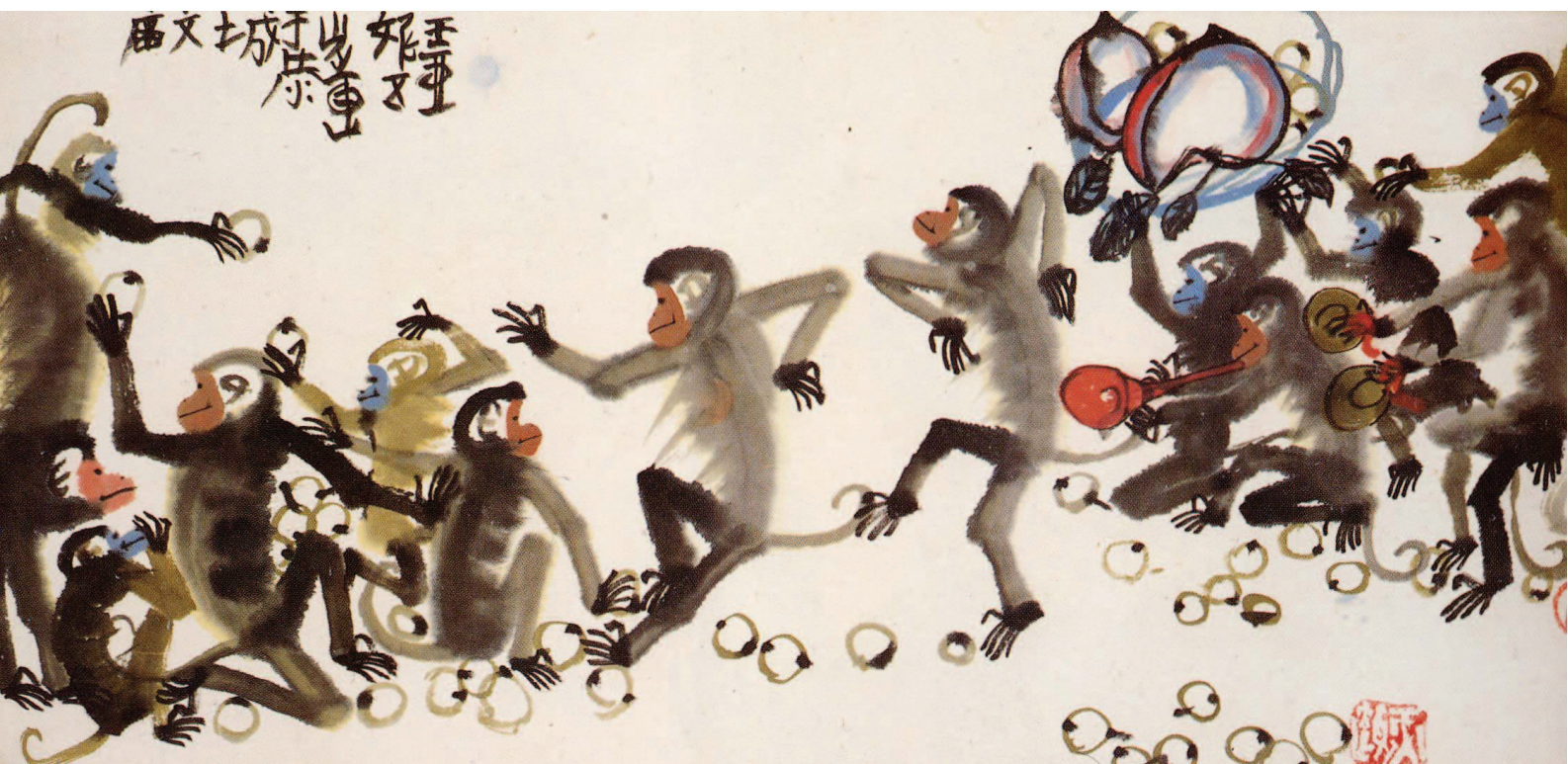
圖7 讓我們開個同樂會(亞妮畫於五歲)

當人們期望了解視覺藝術高成就者的發展過程時，必須透過傳記學和心理學的研究方法去分析一些藝術家的養成與其奮鬥歷程(Howe, 1999)。就輔導教育的立場而言，這兩方面的研究成果均有助於我們協助每一個熱愛藝術的人去