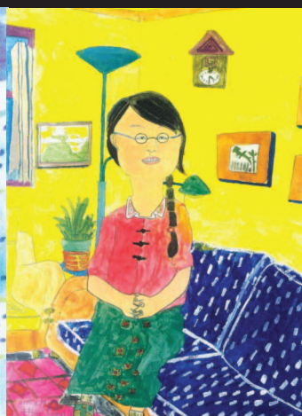
圖19 牡丹老師來訪時(育立畫於八歲)