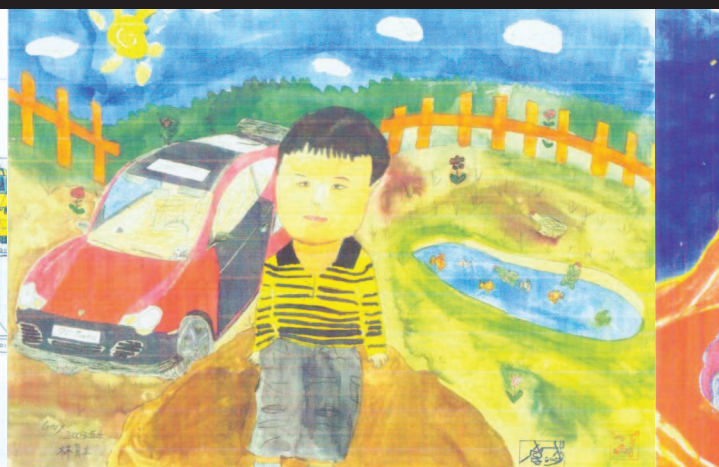
圖16 自畫像(育立畫於八歲)