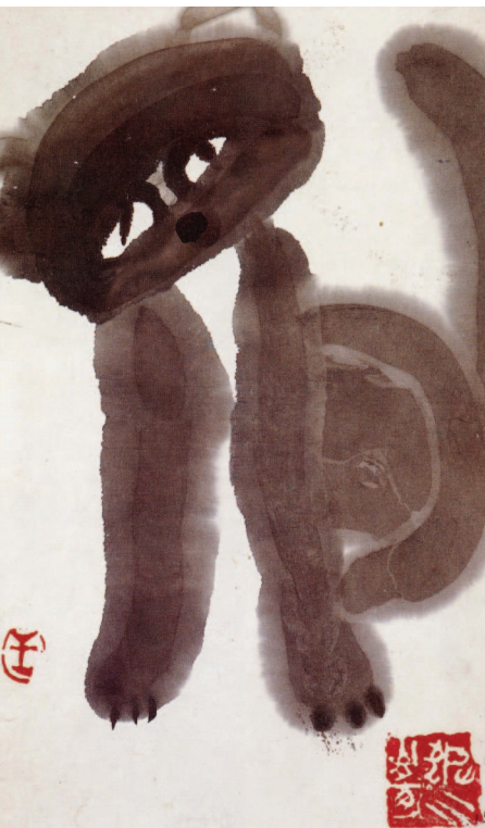
圖1 小貓 (王亞妮畫於三歲)