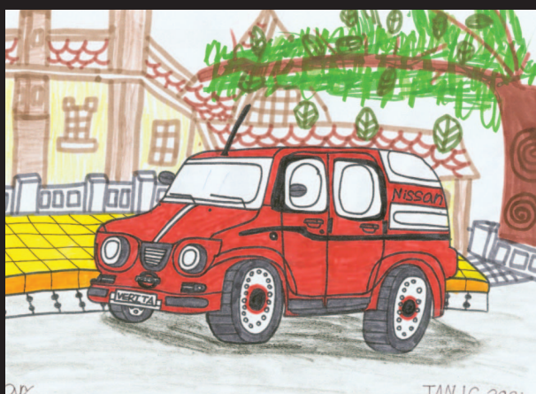
圖6 新的休旅車 (育立畫於五歲)