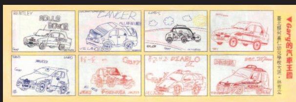
圖8 汽車王國 (育立畫於四歲)