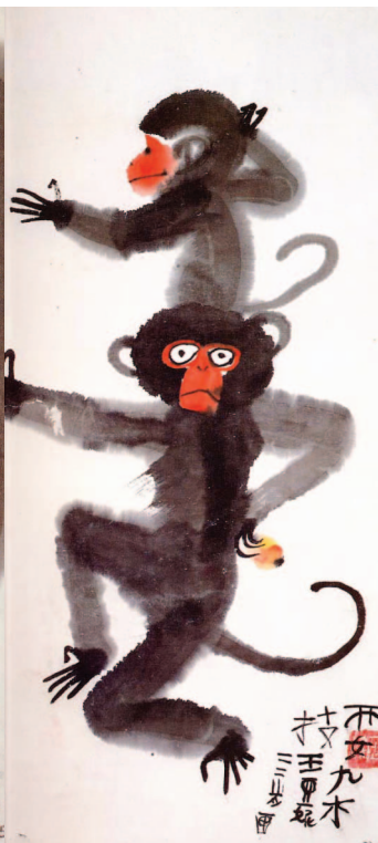
圖2 特技表演 (王亞妮畫於四歲)