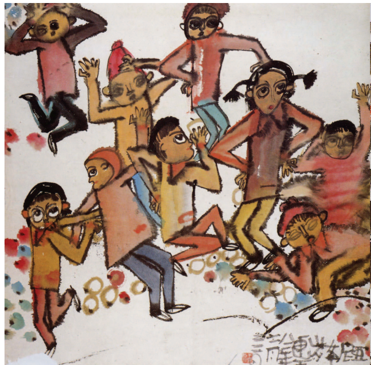
圖13 舞會 (亞妮畫於七歲)