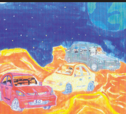
圖17 火星探險(育立畫於八歲六個月)

「視覺文化」(Visual Culture)包含我們生活中所有的視覺藝術、表演藝術、錄影帶、電視、電腦繪圖、玩具、廣告版、連環圖畫、時裝、景觀設計、包裝設計、購物中心，汽車以及任何其他的人為視覺影響。它包含理念、信仰，和其他存在於視覺對象裡的以及相關的觀念(Freeman, 2000)。近幾年來，教育學者探討此一理念的論述為數甚多。