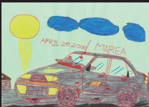
圖5 汽車上的月光 (育立畫於四歲)