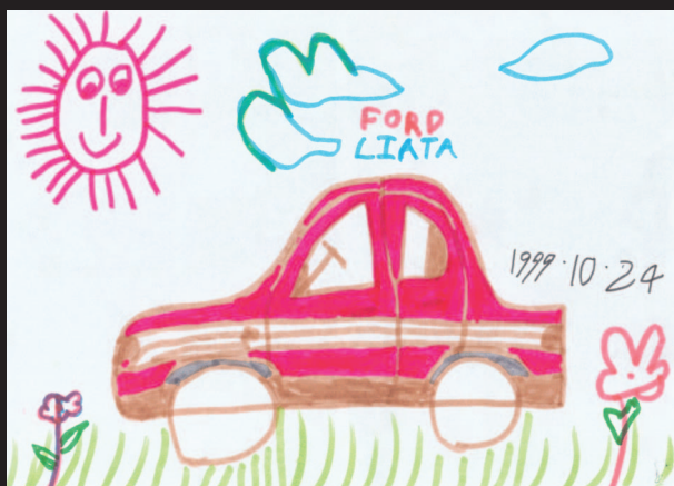
圖4 紅色汽車 (育立畫於三歲)

當筆者仔細觀賞過亞妮出版於一九八四和一九八九年的兩本畫集之後，對於她描繪猴子表情、動作和體態以及運用濃淡墨色去表達自己的想法留下深刻印象。以下選錄亞妮的四幅畫：「小貓」(圖1)、「特技表演」(圖2)、「我不怕」(圖3)、「讓我們開個同樂會」(圖7)，以及育立的四件作品：「紅色汽車」(圖4)、「汽車上的月光」(圖5)、「新的休旅車」(圖6)、「汽車王國」(圖8)作為研究分析的參考。從這些作品可看出王亞