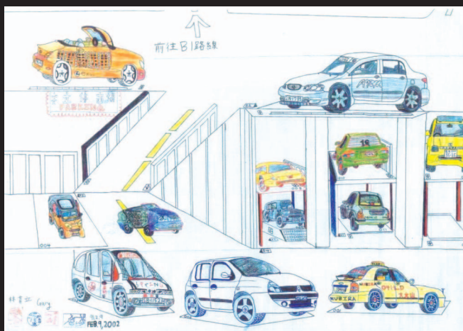
圖15 以對開紙張設計12輛汽車的「停車場」(育立畫於六歲九個月)

繪畫作品特徵是從藝術作品本身可以直接看得到的特徵，包括構圖安排、繪畫要素與原理原則的應用、題材、製作技巧等等。學生的繪畫行為則分為藝術表現的氣質