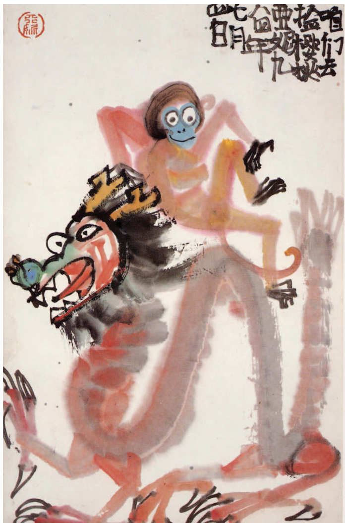
圖21 讓我們去採櫻桃(亞妮畫於九歲)