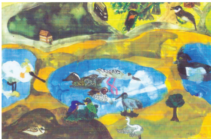
圖22 關渡賞鳥(育立畫於八歲)