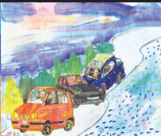
圖18 太陽下山了，我帶路回家(育立畫於八歲兩個月)