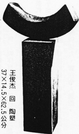
王俊杰 回 陶塑 37×14.5×62.5公分

點，成為視覺上的焦點，其目的是要藉著這顆小白點，導引觀賞者的視線進入作品所要表達的意念之中。因此，在他的作品中所出現的小白點，雖然看似固定在一個點上，其實，它是正沿著自己的固有軌跡在運動中的。