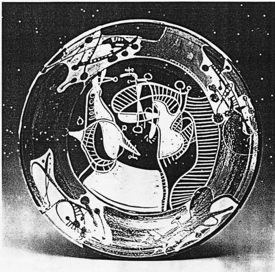
顏炬榮 彩繪雙鯨陶盤 1988 高35公分

追求自然與純樸，他說：「對我而言，最重要的是忠於自己的工作與生命。促進人類和諧，結合大自然與自然材質。而我的陶藝創作，亦正是我的生活經驗。」對顏炬榮而言，「創造」不只是一個字彙，它更是生活的一種方式。他是