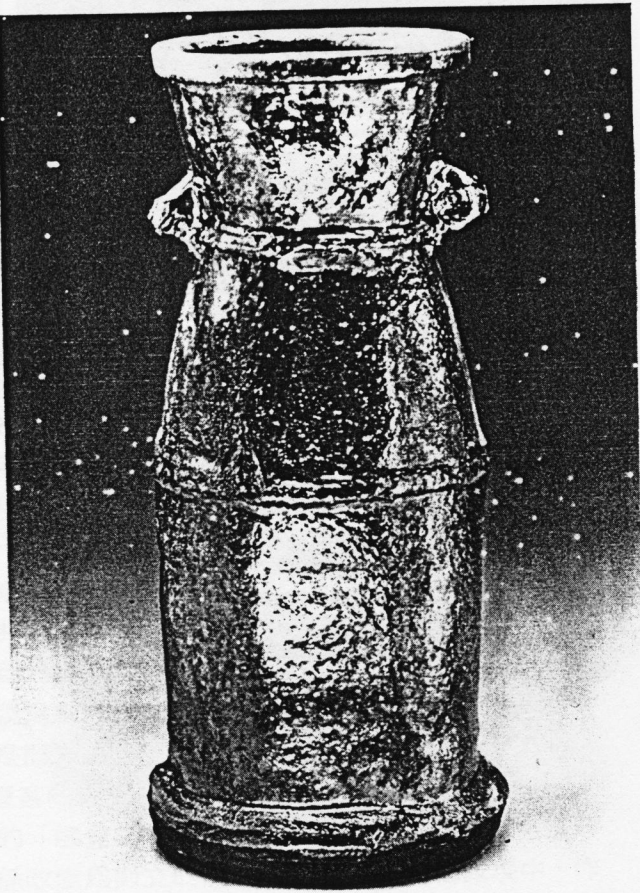
顏炬榮 附耳金質瓶 1988 高34公分

除鹽釉在作品表面造成白色斑點的特色外，他還利用拉坯指痕，或作品外表切割分面的方式，使鹽釉在作品表面產生深淺的釉調變化。甚至在部分作品的表面，刷上不同於坯土顏色的化粧泥漿，讓鹽造成不同的呈色，以增加作品的釉色表現。