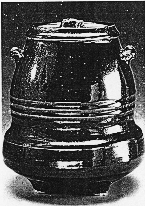
顏炬榮 附耳黑釉廣口陶瓶 1988 高24公分

是以人的頭像或飛鳥的寫生為主；另一類則是利用白色瓷坯塗施深色化粧泥漿，再刻劃出線紋的抽象圖案。無論具象或抽象圖案，其構圖的靈感，皆是來自他生活環境中所觀察到的事物。