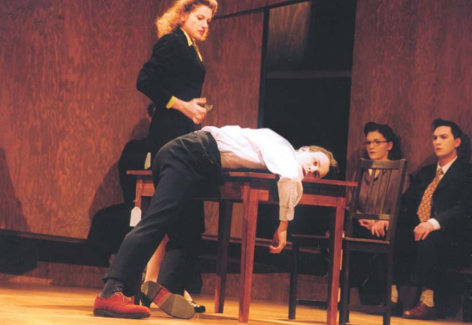
蘇菲槍殺男友

應，無一不讓人心驚，最後不得不驚呼：「對，就是這樣 (C'est ça)」 8 。這種編劇手法強調的是「絕對瞬間」(l'absolu de l'instant)之重要性，一種「現在當下的絕對飽和」(absolue plénitude de l'instant présent)，各式衝突、斷裂的意義、音調的差距充斥其間，使得思想、力量以及情感為之爆發，人物的心理遂無從發展，場景之間的邏輯亦屬假定 9 。維納韋爾編劇通篇採用此種手法，其錯綜複雜的對白組織，嚴厲地考驗導演的能力。