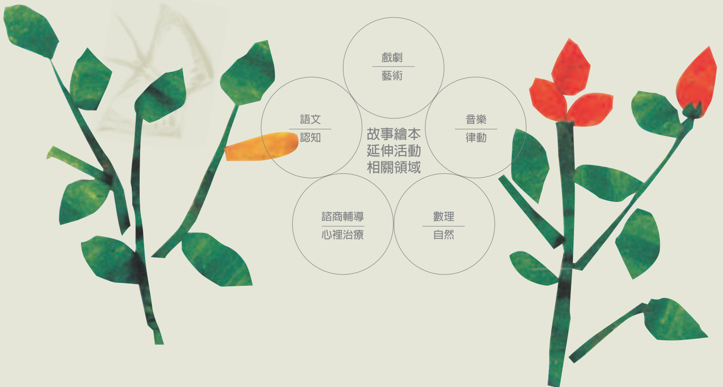
■ 表1 圖畫書的多元領域

「統合」代表人格成熟的一種狀態，它係指個體綜合當前自我、生理特徵、社會期待、以往經驗、現實環境、未來希望六個層面，統而合之成爲一個整體的人格結構，使個體對於「我是誰？」、「我將走向何方？」的問題，不再有徬徨迷失之感。此種肯定自我的感覺又稱「自我統合」，也稱「個人統合」。完形心理學者主張任何心理現象都是有組織的，是不可割分的整體。而美國藝術教育學者羅恩斐爾(Viktor Lowenfeld)論及幼兒及兒童的各階段發展，皆包括：智慧、感情、社會、知覺、生理、美感、創造性等層