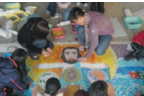
■ 校外藝術教育提供具藝術才能學生有更大發展空間：香港學生在假日由校外藝術家黃鉅雄指導合作馬賽克大壁畫。