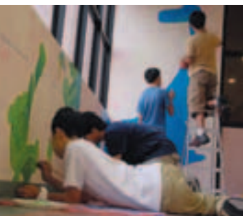
■ 全方位學習有利學生培養對社區的歸屬感。(林桂光提供)