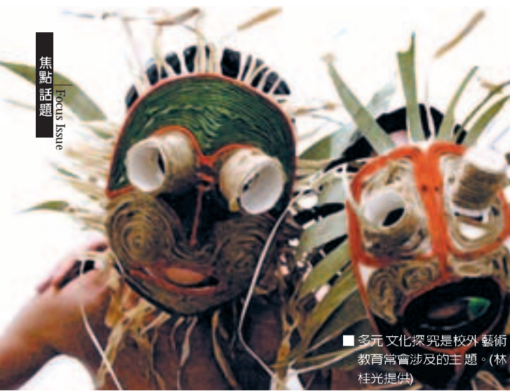
■ 多元文化探究是校外藝術教育常會涉及的主題。