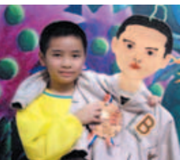
■ 校外藝術教育較有條件幫助學生探索身分認同的課題。

術界所倡導「一生一藝術」的概念。共有三十四間學校參與，約三萬學生受惠。期間曾參與計畫的藝術家共四十四名及藝術團體十七個。另外又在二〇〇一年，同樣和藝術發展局合作，亦得到匯豐銀行慈善基金贊助，推行一項為期三年的「薈藝教育計畫」，作為「藝術家駐校計畫」的延續。計畫目的是透過學校和藝術家的合作，在正規課程探求創新及可行的模式，把藝術的學習有組織地與其他科目結合，進一步發展藝術教育。計畫為期三年，首年先為教師及藝術家進行培訓工作，再由教師和藝術家合作，在學校進行各式各樣的藝術學習活動，並將學習成果，透過不同形式的展覽或表演，向公眾展示。在宏觀的課程設計理念下，校內的學校課程，只是基礎教育的一個部分，我們有需要關注學生在其他學習時段、學習空間、學習內容所產生的學習成效，並視為基礎教育的伸延和補充。這種課程發展理念在香港教育統籌局上載的課程改革文件內，都有詳細的介紹，目的希望鼓勵學校要主動和有計劃地全面設計學生的學習內容，以期有系統地產生具質素的學習成效。