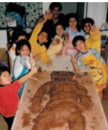
■ 不同材料的接觸可以刺激學生對造型創作的思考。