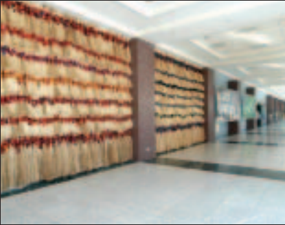
右圖 拉黑子 微弱的力與美 2003 (卑南史前博物館提供) 左下圖 尤瑪達陸 展開夢想的翅膀 2003 (卑南史前博物館提供) 左上圖 李永明 對話 2003 (卑南史前博物館提供)