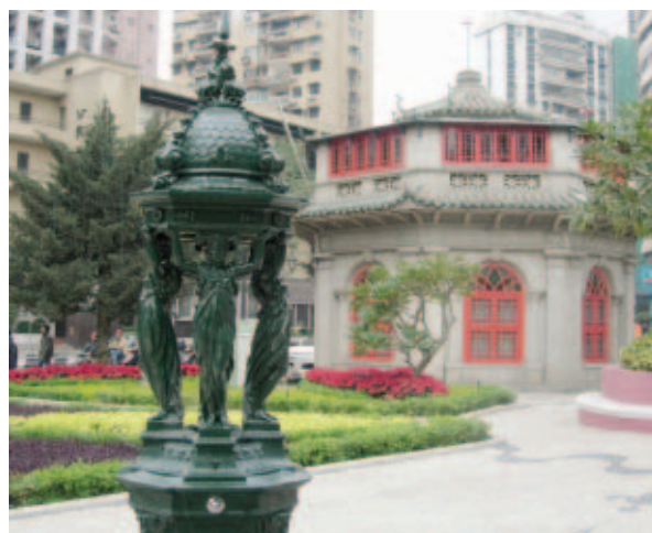
圖上 金蓮花（澳門市花）廣場與美資賭場遙遙相對（陳美玉提供） 圖下 八角亭圖書館與「和麗女神」噴泉（陳美玉提供）