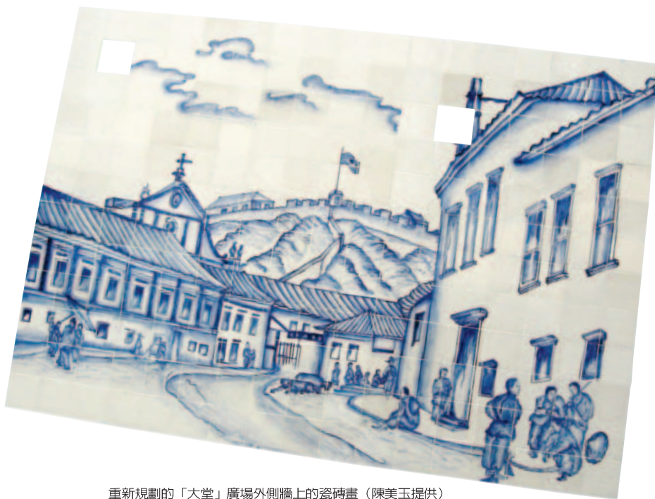
重新規劃的「大堂」廣場外側牆上的瓷磚畫

對於急劇變化的生活建築環境，澳門的報人私下積極呼籲文化及教育界發表意見，行使公共監督的權利 3 。前述的大堂前地休憩區在我拍照後一個多月竣工啓用時（即本文完成初稿之後），原來鋪砌在牆上的瓷磚畫全部消失了，據說樸素的牆壁是體現影壁的中式建築特徵 4 。我沒法求證這個令人有點「驚喜」的結果，是否文化教育界在過去數月來不停的批評所致，因為第二座「和麗女神噴泉」已於二〇〇五年三月在離島啓用了（澳門日報，2005年3月23日），對兩座噴泉的設置卻鮮有人提出質疑。