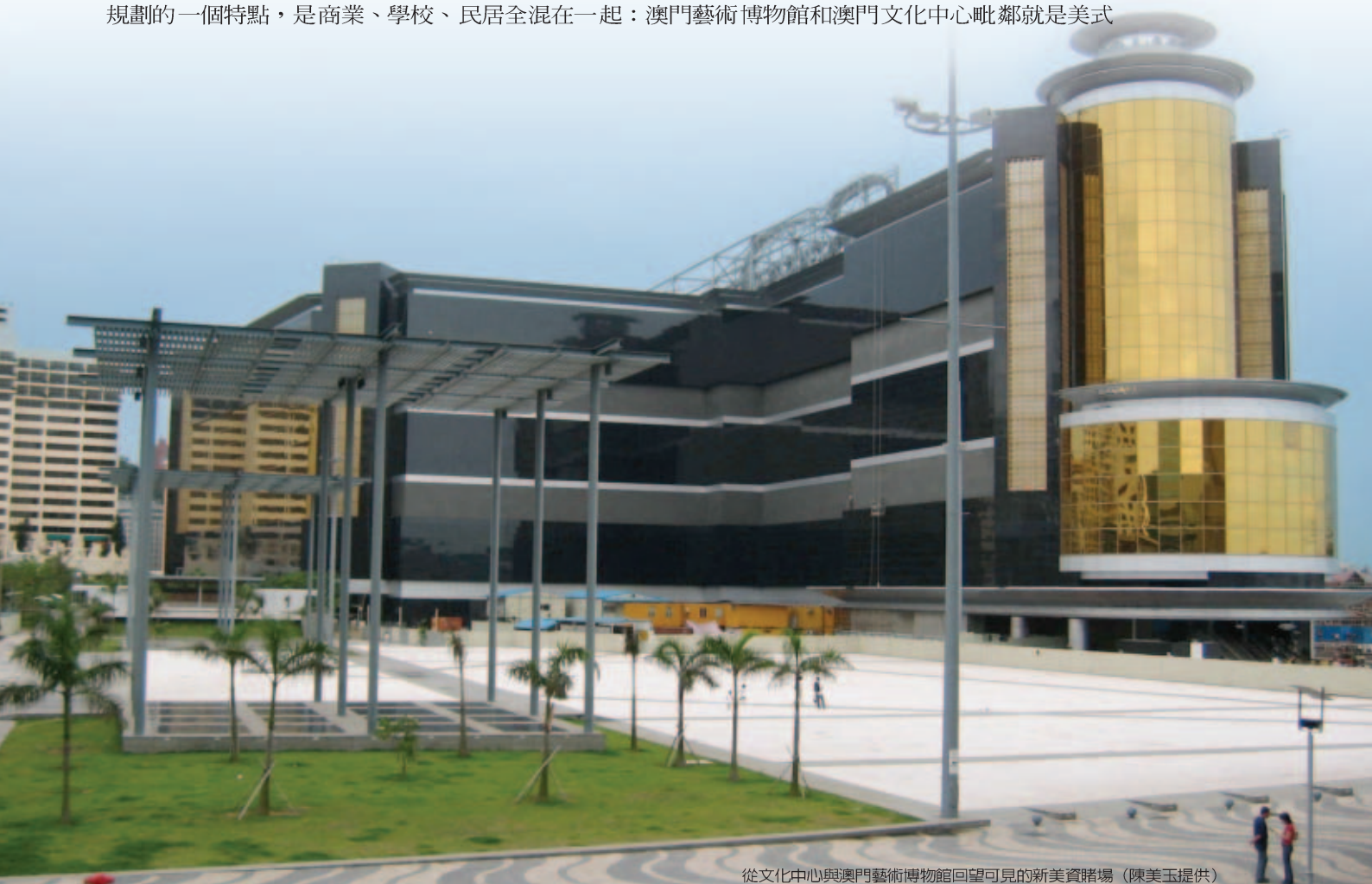
從文化中心與澳門藝術博物館回望可見的新美資賭場

城市中種種的造形風格、氣味、色彩、物件、價值和符號，舉凡建築的造形與用途、公共與私人空間的規劃、環境的空間結構等等，皆有可能因政府或財團的運作而取得法定的掌控權，在特權考量之外的文化意義便被忽略；當大商家以雄厚的資金，繞過公民力量的制衡擴張其影響力，又得到政府的協助達到支配公共空間的用途時，就是公民權利被漠視的嚴重時刻。澳門開放賭權，自二〇〇四年五月新賭場啓業後，短短七個多月的時間，澳門賭業稅收即近一百五十億澳門元（約新台幣六百億，澳門日報，2004年12月4日），本地及外地大小財團開設的賭場已佔領了澳門的新商業中心區，自港澳碼頭沿海旁大道直走到舊的商業大道，兩旁全是賭場或所屬的娛樂場所。澳門城市規劃的一個特點，是商業、學校、民居全混在一起：澳門藝術博物館和澳門文化中心毗鄰就是美式