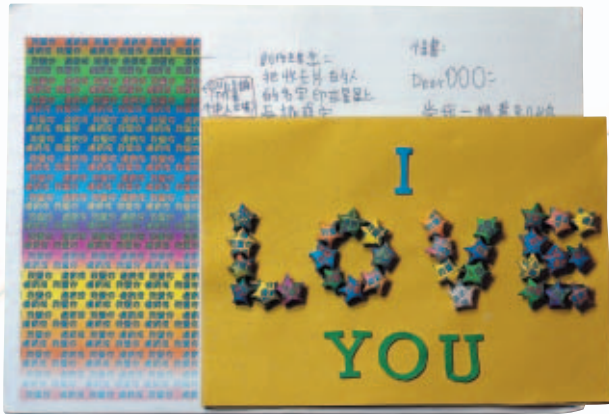
圖8 唐嘉瑛「把收卡片的人名一排排印在紙上，割下來後摺成星星，再把星星排成LOVE的樣子黏在卡片上。」