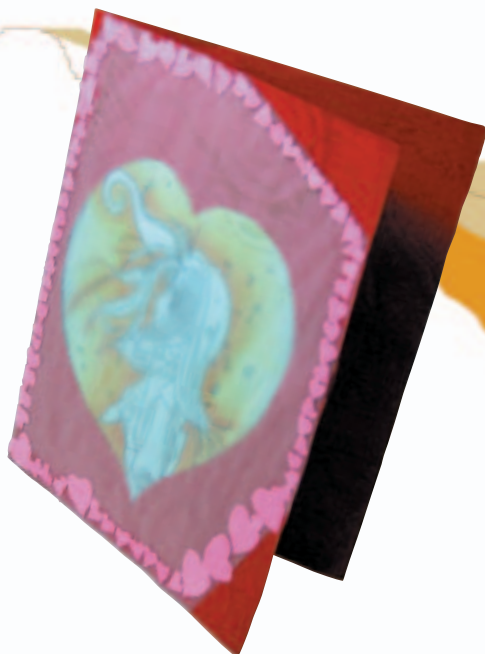
圖7 黃雅荅「這是在分手後，始終忘不了對方的深情卡片。分手後難免有些傷感，而秋天是富有詩意卻又蕭瑟的季節，落葉紛紛，充分的表現出無盡的思念。」

就畫兩個類似的人，她的檢討可以看出她選擇技法的過程，以及不斷修正的靈感。小臻的卡片是給她的偶像「土方歲三」(圖2)，他是誰呢？身為教師的我不了解，但是熱心的小臻不僅影印資料並告訴我，他是日本幕府時代新選組副長，是一位豪氣萬千的武士，在日本新政府軍進攻時，騎馬出陣並於交戰中在馬上中彈身亡，享年三十五歲。小臻怕他不諳白話文，還寫了一封國語文言文的信給他，這時如果我不識相的問他看得懂中文嗎，可能會被學生笑太不上道，所以我真心的讀了小臻的信：