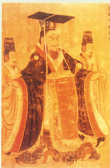
▲歷代帝王圖卷(部份) 唐(傳)閻立本

但冕服所關種種「文以載道」的精神涵義，非關本文的重點，其中有一部分在本文從略不敘。