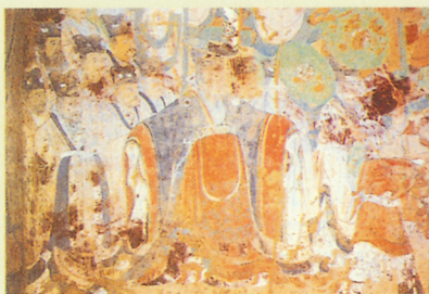
▲維摩詰經變（局部） 帝王與群臣 初唐 敦煌二二〇窟 東壁南側

「非帷裳，必殺之。」的殺字，在此讀音「賽」（尸旁、Shoi）的字義是剪縫。就是說，不是帷裳，就要剪縫，這是常服。若是「帷裳」，那是後四幅連接成一大塊，由後向前裹身；前三幅亦成塊，向後裹身；其形如帷，因名「帷裳」，這是禮服。前三幅是單數，象徵陽；後四幅，象徵陰。（注1）這種前三後四之制，正也是「順陰陽」的表徵。《禮記》〈禮運〉說：「孔子曰：我欲觀夏道，是故之宋，而不足徵也。吾得乾坤焉。」注：「得陰陽之書也。」觀此又可知：這也是儒家的服飾理念之一端。所謂「順陰陽、明教化」的意義，乃在凡事務求其正常存在和運行，不